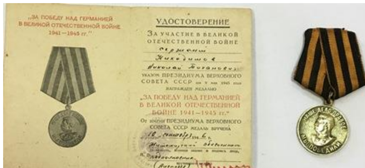
Медаль «За Победу над Германией в Великой Отечественной войне 1941-1945»