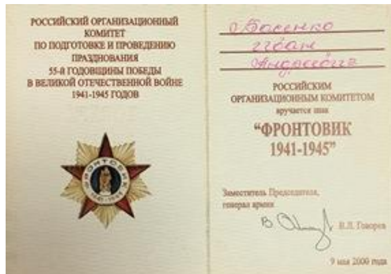
Знак «Фронтовик 1941-1945»