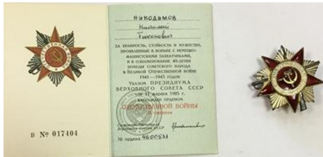
Орден и удостоверение к ордену Отечественной войны II степени