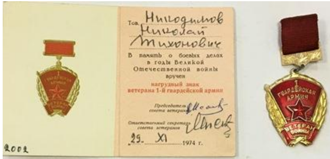
Нагрудный знак ветерана 1-й Гвардейской армии