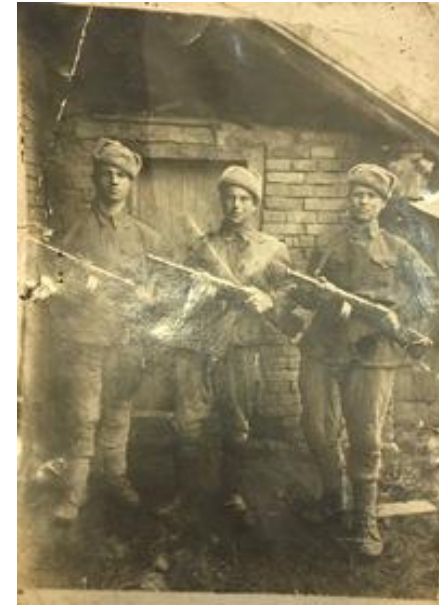
Подпись на обратной стороне фотографии «В дни службы в Крестьянской Армии 1944 год»