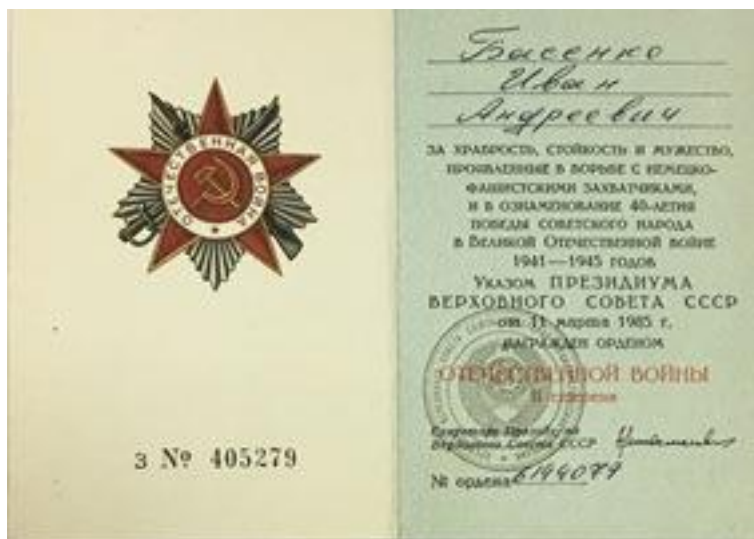
Орден Отечественной войны II степени