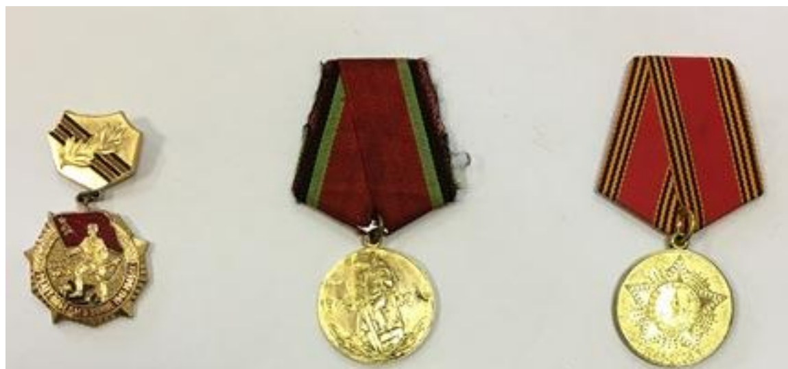
Юбилейными медалями Победы в Великой Отечественной войне 1941-1945 гг.