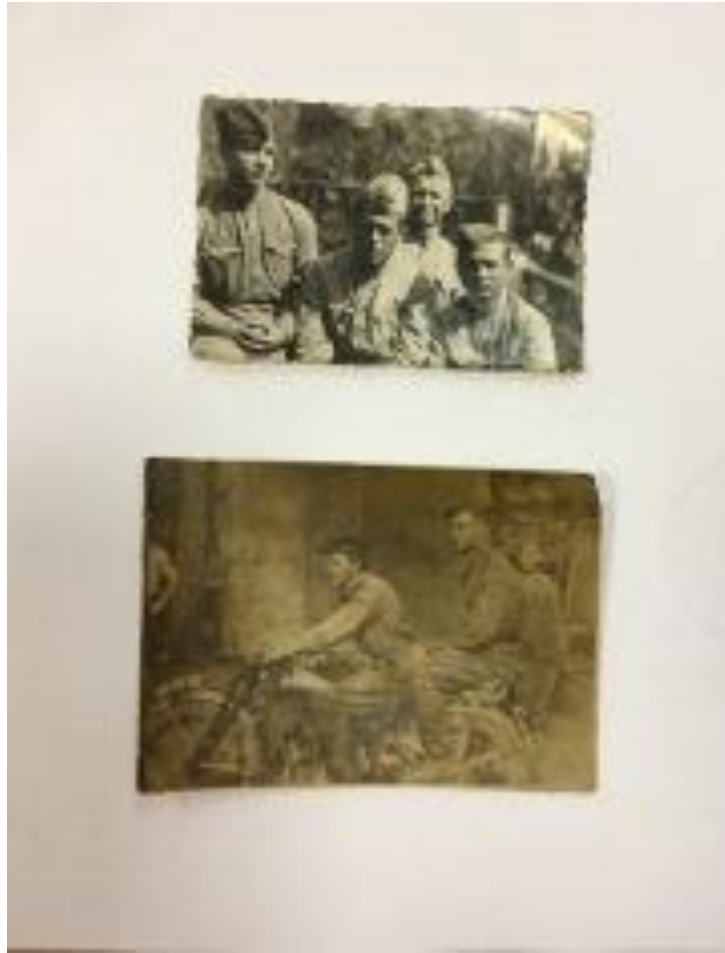
Подпись на обратной стороне фотографий «Память службы 1945 год»