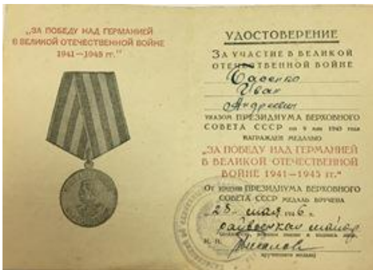
Медаль «За Победу над Германией в Великой Отечественной войне 1941-1945