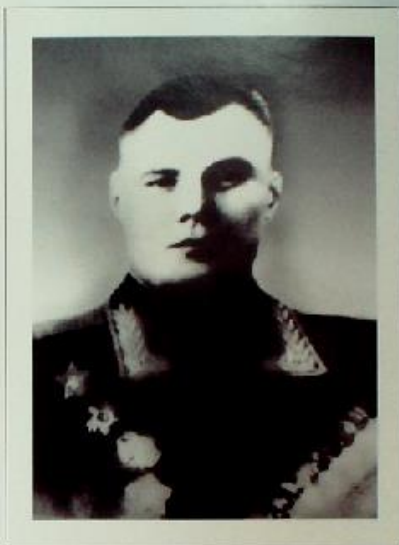
Максим Гаврилович Скляров

После окончания войны занимал ответственные посты в Министерстве Обороны. Генерал-майор авиации М.Г.Скляров погиб в авиакатастрофе в декабре 1958 года.