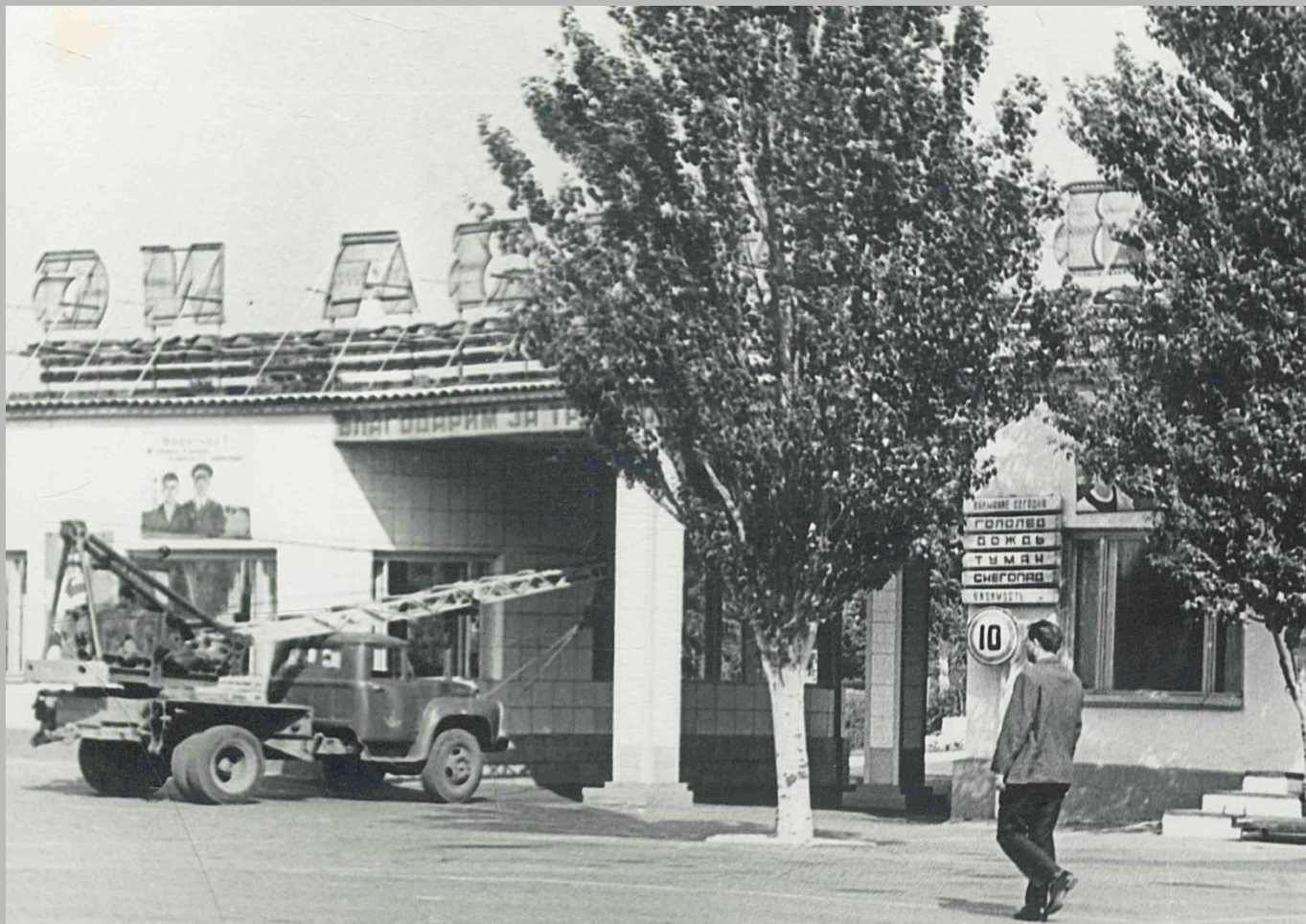
Фотодокументы группы «Д», Опись 1, Дело Д-2, Лист 26.