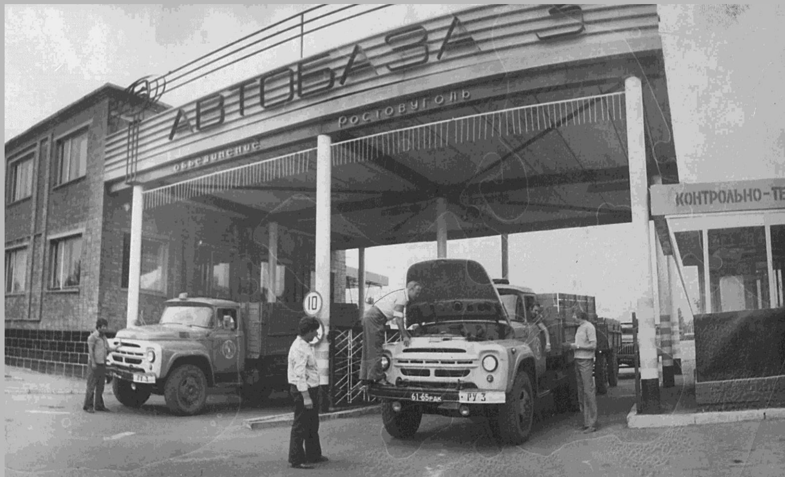
Фотодокументы группы «ПА», Опись 1, Дело ПА- 693.