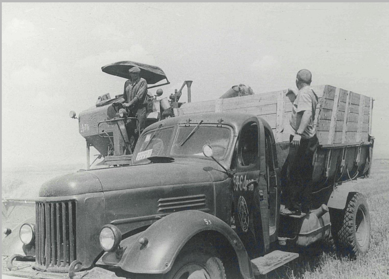
Фотодокументы группы «Д», Опись 1, Дело Д-2, Лист 33.