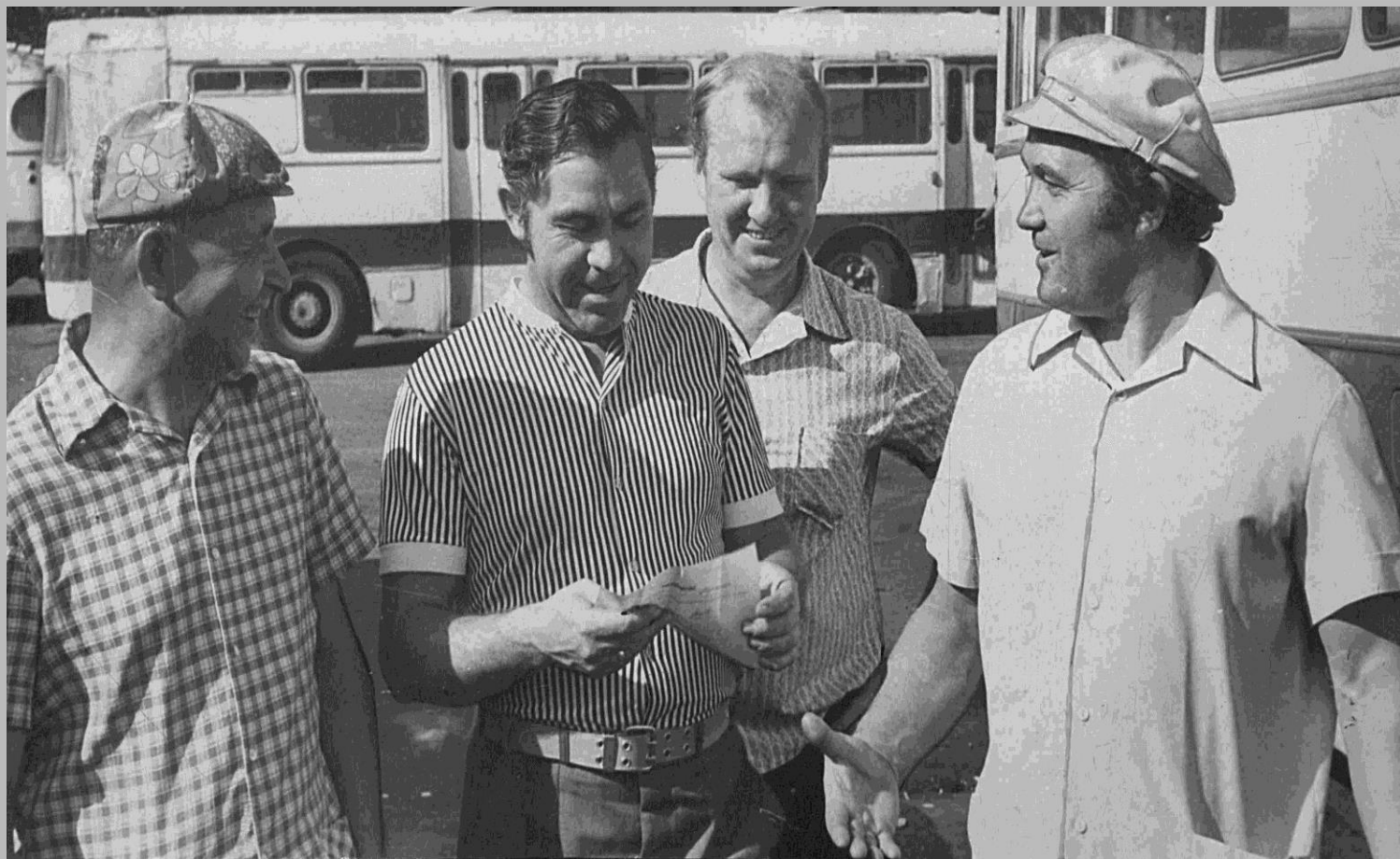
Фотодокументы группы «ПА», Опись 1, Дело ПА- 735.