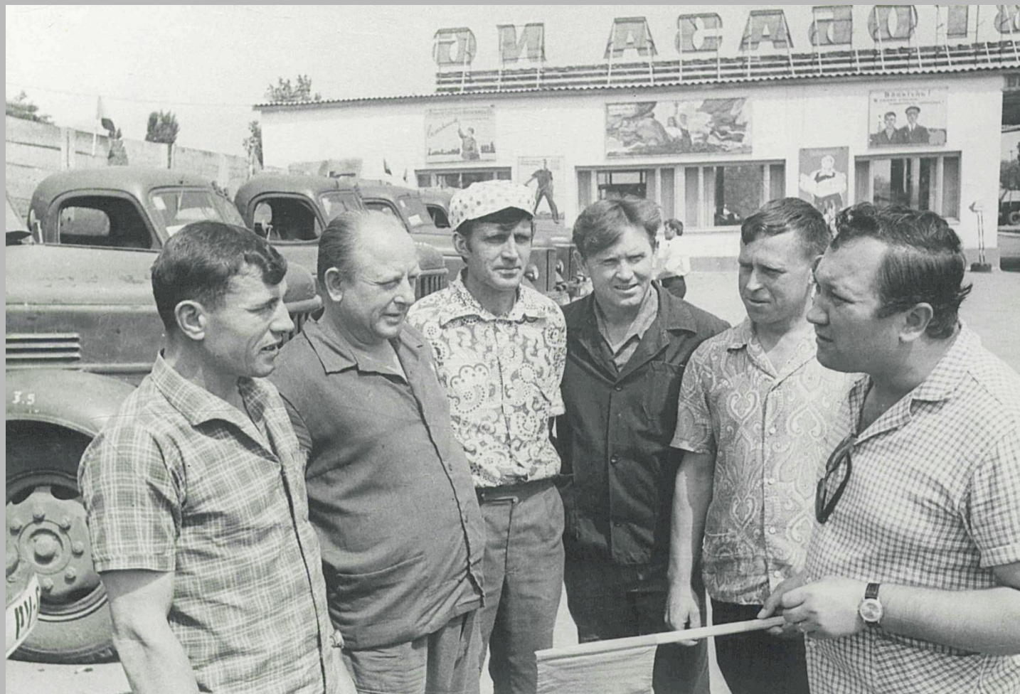
Фотодокументы группы «Д», Опись 1, Дело Д-2, Лист 30.