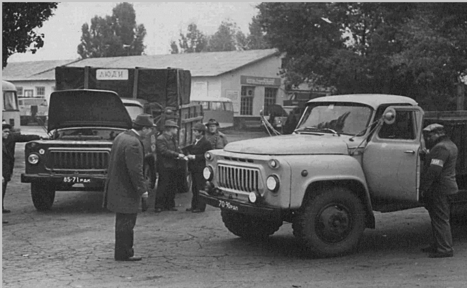
Фотодокументы группы «ПА», Опись 1, Дело ПА- 750.