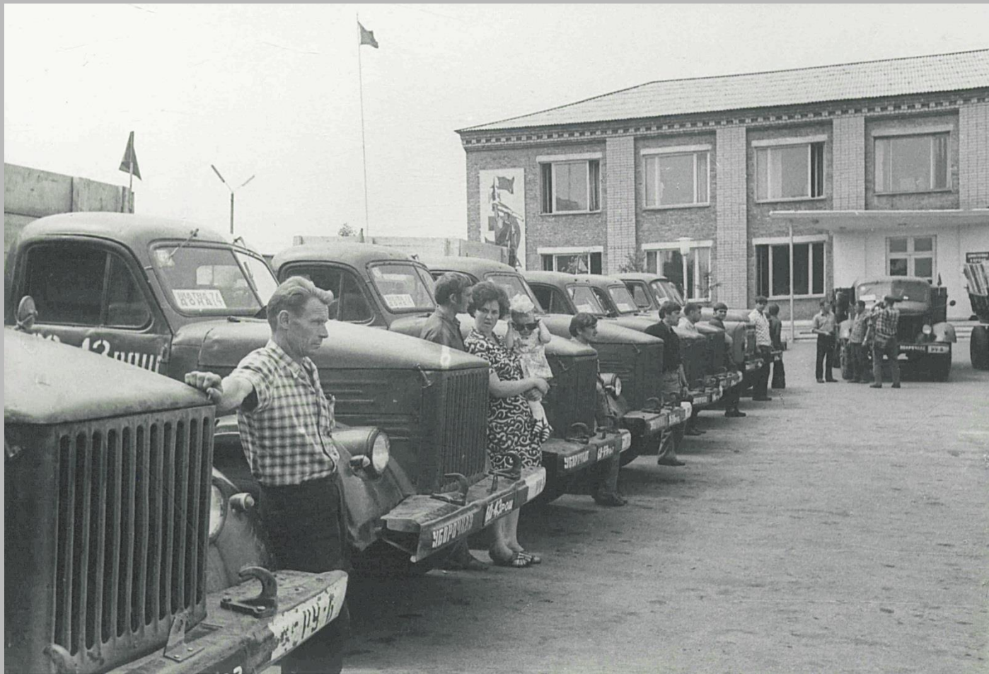
Фотодокументы группы «Д», Опись 1, Дело Д-2, Лист 29.