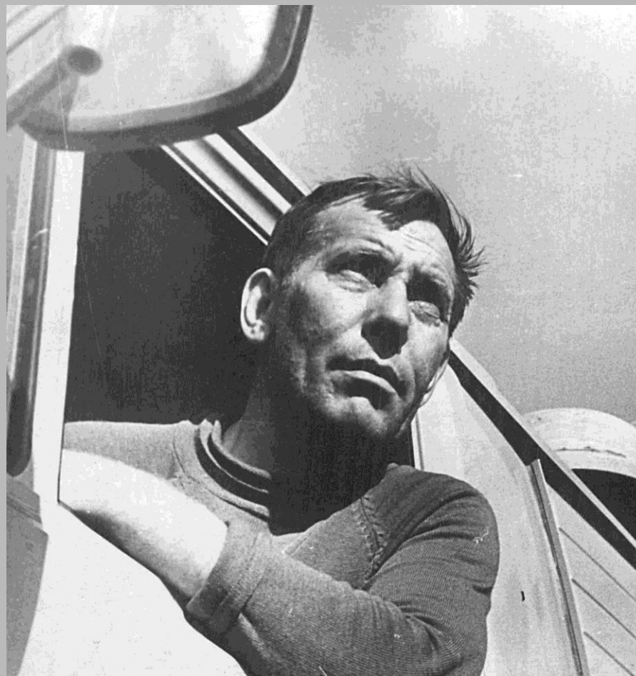
Фотодокументы группы «ПА», Опись 1, Дело ПА- 718.