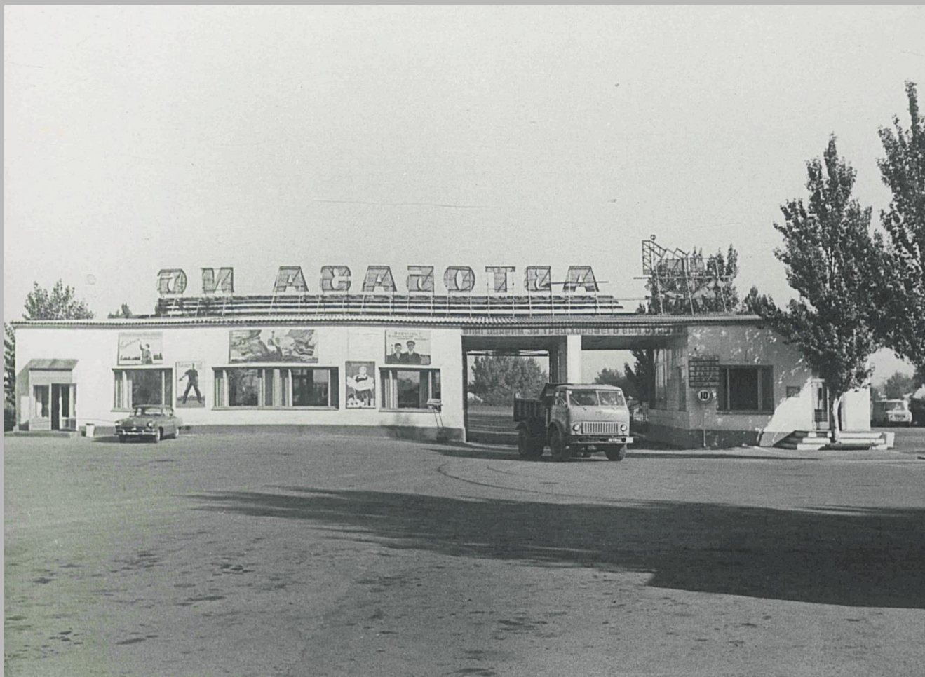
Фотодокументы группы «Д», Опись 1, Дело Д-2, Лист 5.