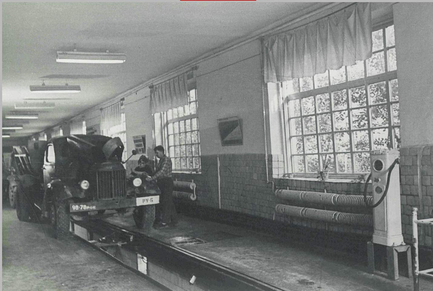
Фотодокументы группы «Д», Опись 1, Дело Д-2, Лист 23.