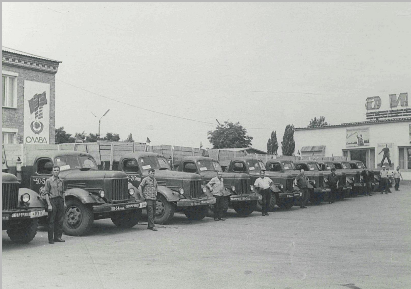
Фотодокументы группы «Д», Описание 1, Дело Д-2, Лист 30.