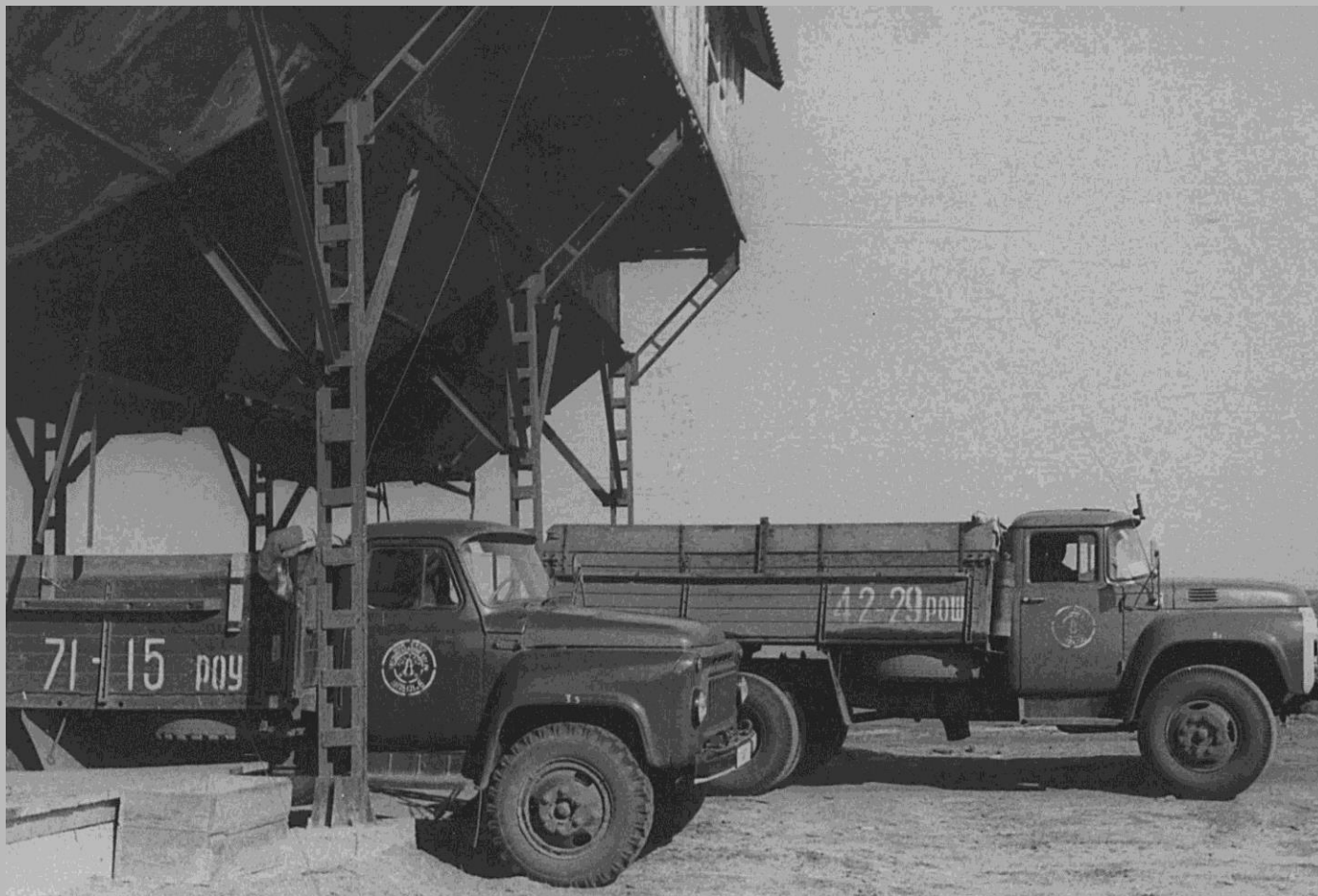
Фотодокументы группы «Д», Опись 1, Дело Д-2, Лист 35.