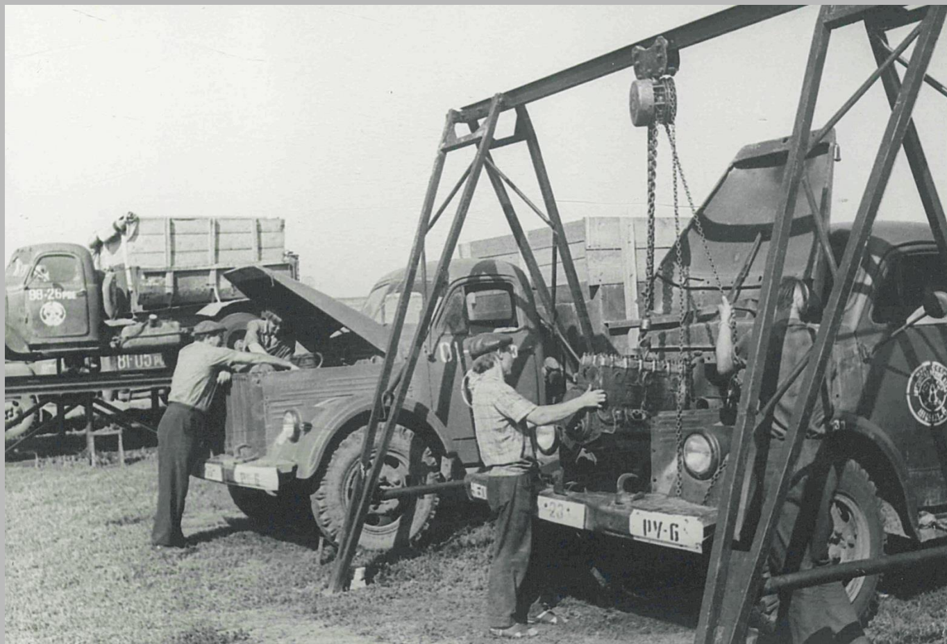
Фотодокументы группы «Д», Опись 1, Дело Д-2, Лист 35.