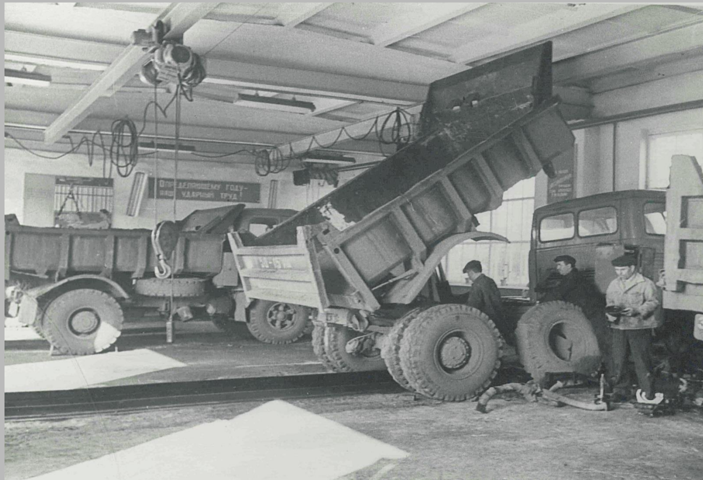
Фотодокументы группы «Д», Опись 1, Дело Д-2, Лист 16.