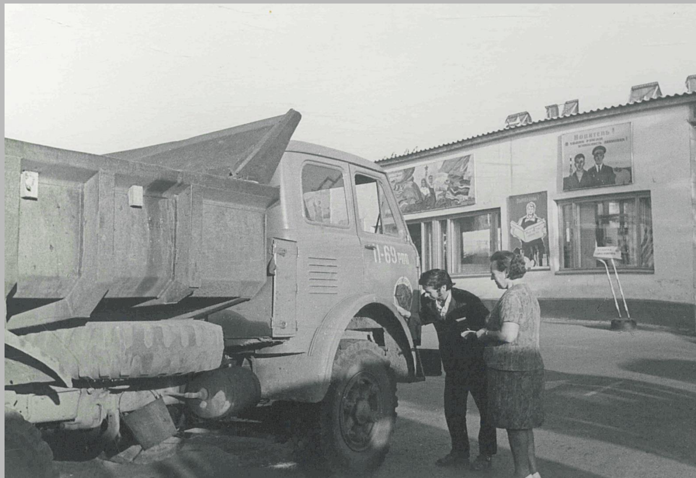
Фотодокументы группы «Д», Опись 1, Дело Д-2, Лист 26.