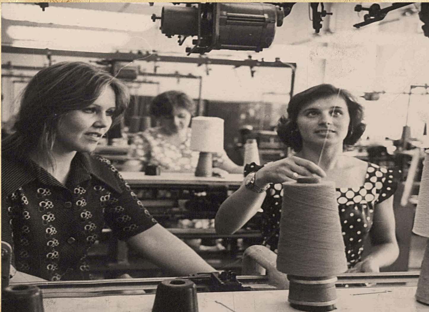
Фотодокументы группы ПА, Опись 1, Дело 1428.