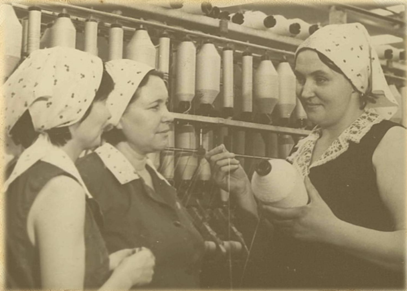
Фотодокументы группы ПА, Опись 1, Дело 632.