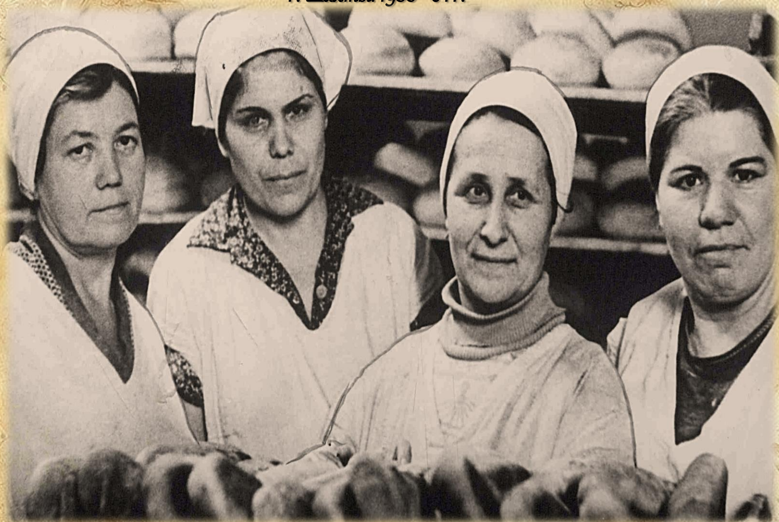
Фотодокументы группы ПА, Описание 1, Дело 1467.