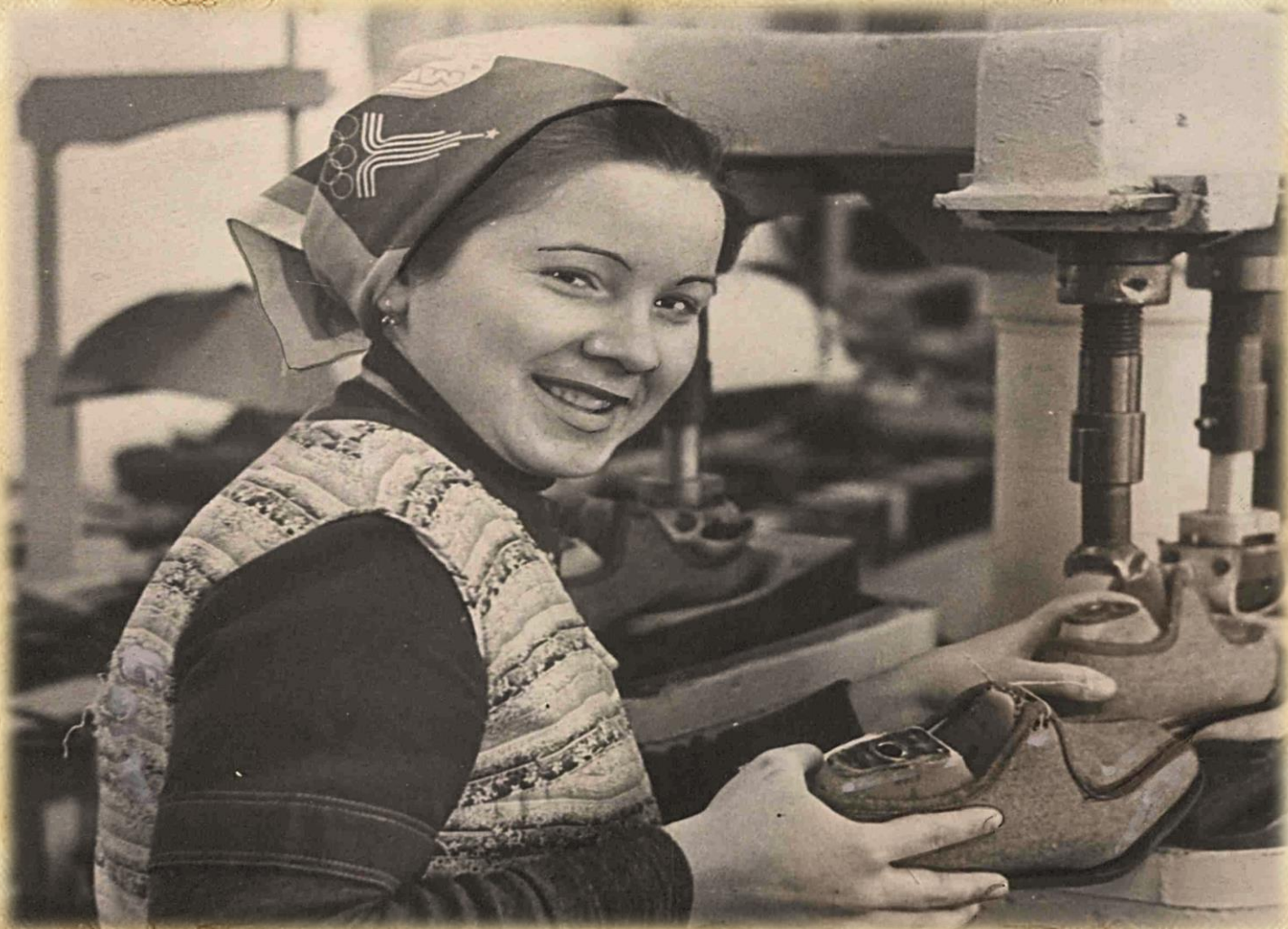
Фотодокументы группы ПА, Опись 1, Дело 47.