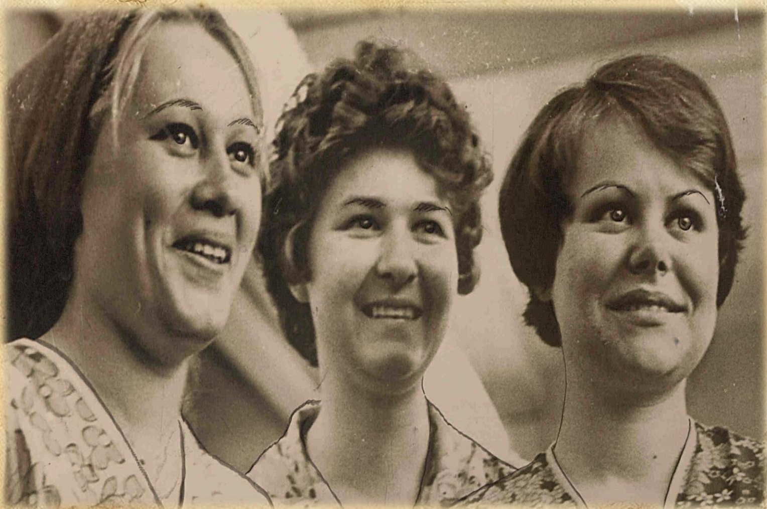
Фотодокументы группы ПА, Опись 1, Дело 39.