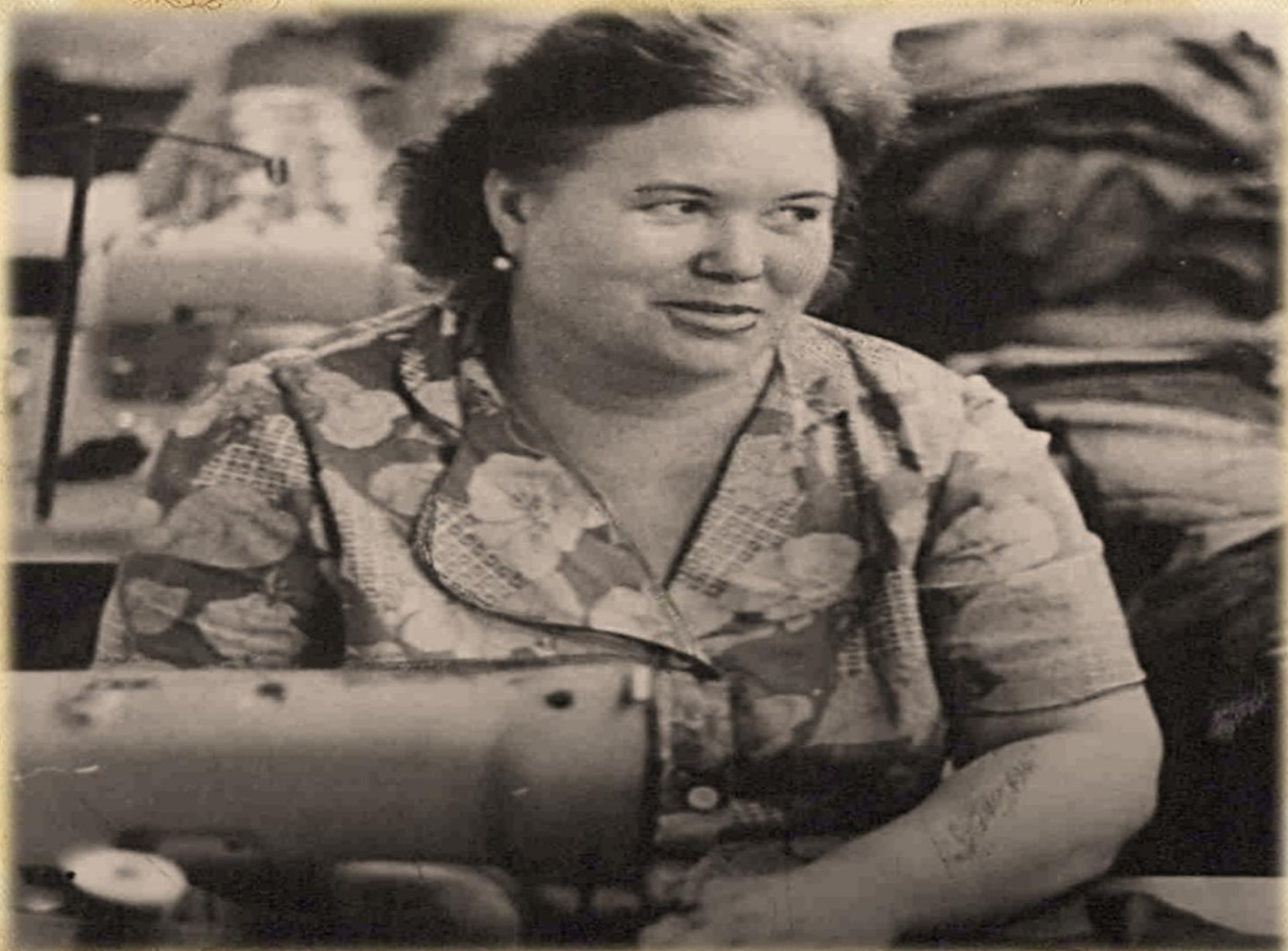
Фотодокументы группы ПА, Опись 1, Дело 1410.