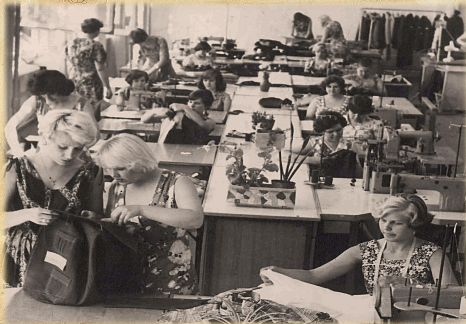
Фотодокументы группы ПА, Опись 1, Дело 32.