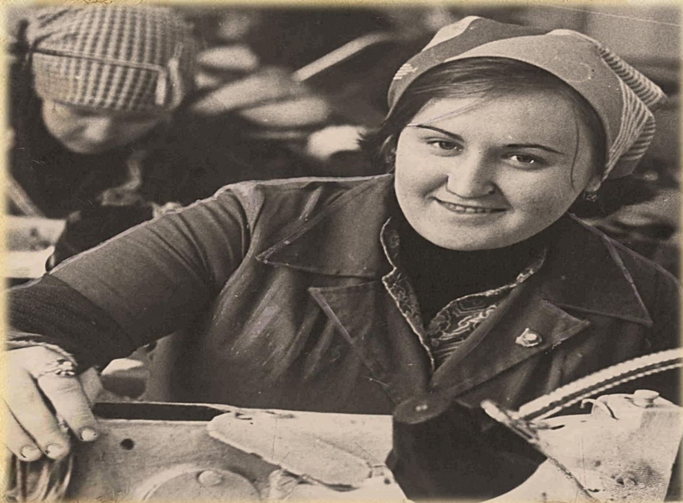
Фотодокументы группы ПА, Опись 1, Дело 95.