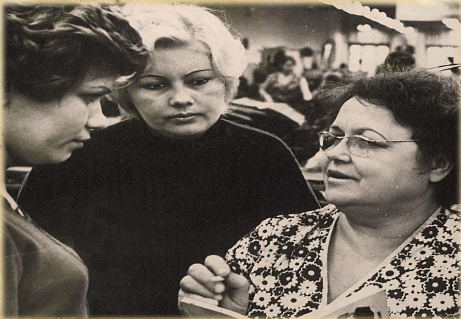
Фотодокументы группы ПА, Опись 1, Дело 17.