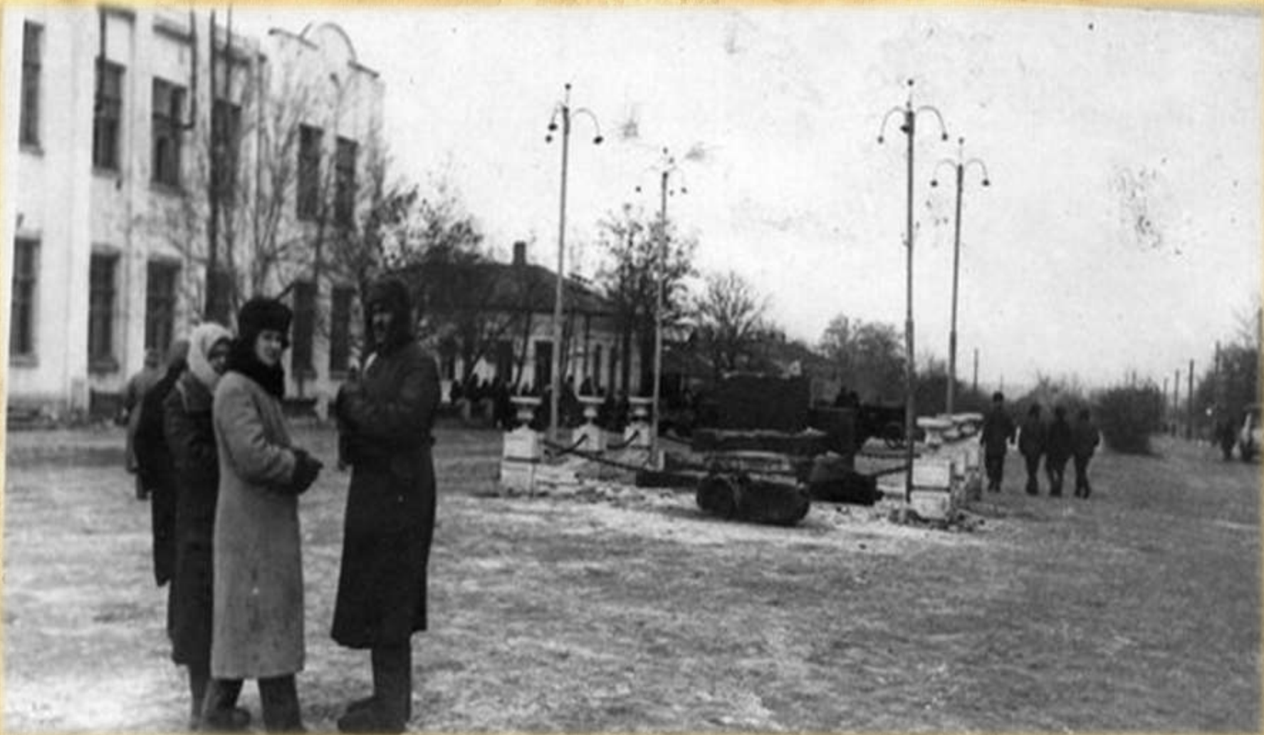
Центральная площадь г.Сальска, освобожденного от оккупации. В центре разрушенный памятник В.И. Ленину. Февраль 1943 г.