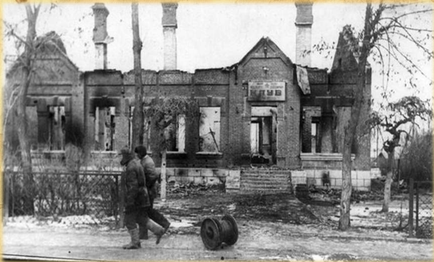
Разрушенный и сожженный немецкими оккупантами Клуб железнодорожников в городе Сальске. Также уничтожению подверглись склады железнодорожной станции, здание вокзала, паровозы, вагоны. Февраль 1943 г.