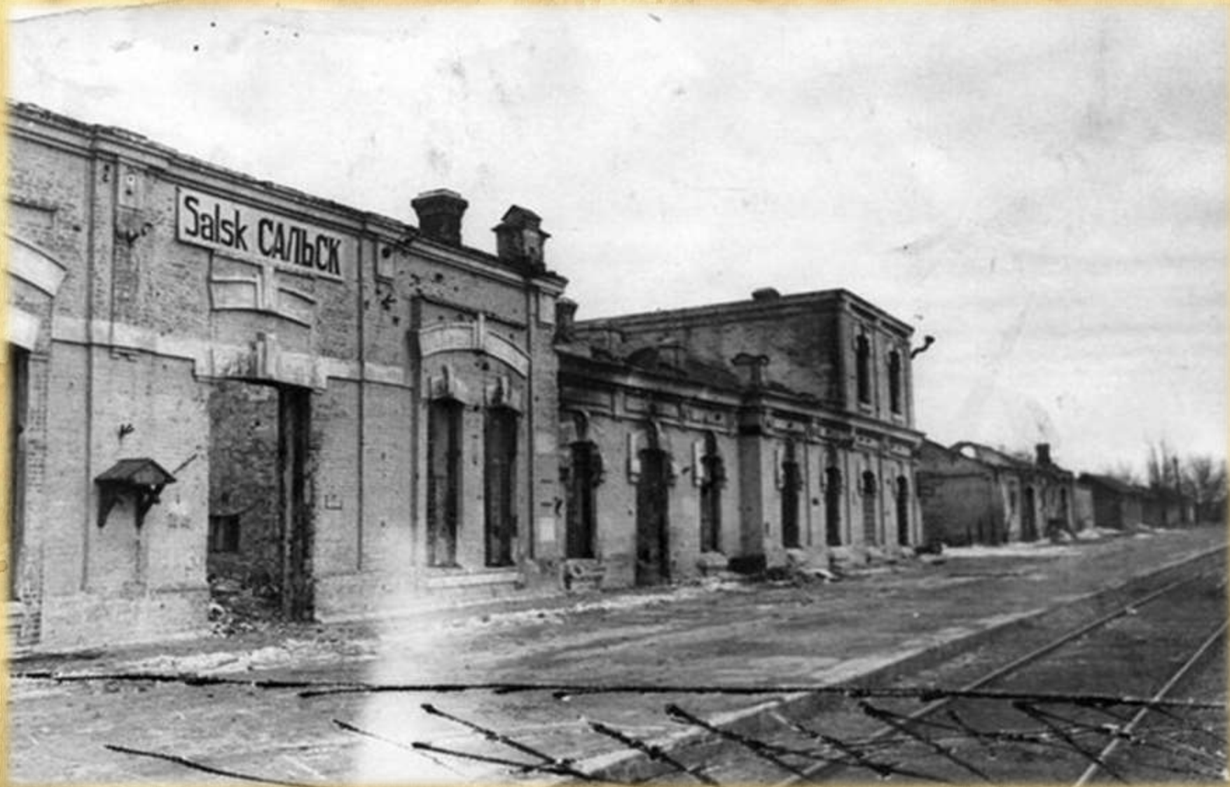
Разрушенное немецкими оккупантами здание железнодорожной станции Сальск Надпись на здании на немецком и русском языках. Январь 1943 г.