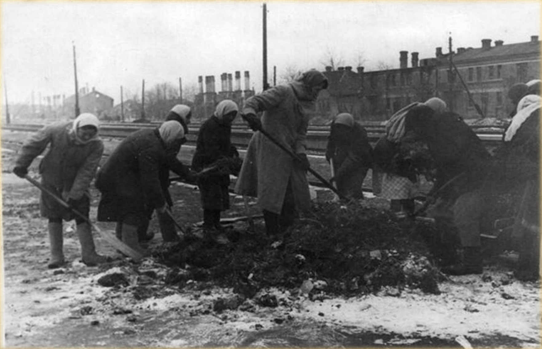
Жительницы города Сальска расчищают железнодорожные пути. Февраль 1943 г.