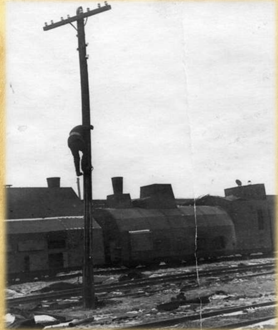
Февраль 1943 года монтеры восстанавливают линию электропередач на Сальской железнодорожной станции, разрушенной немецкими войсками.