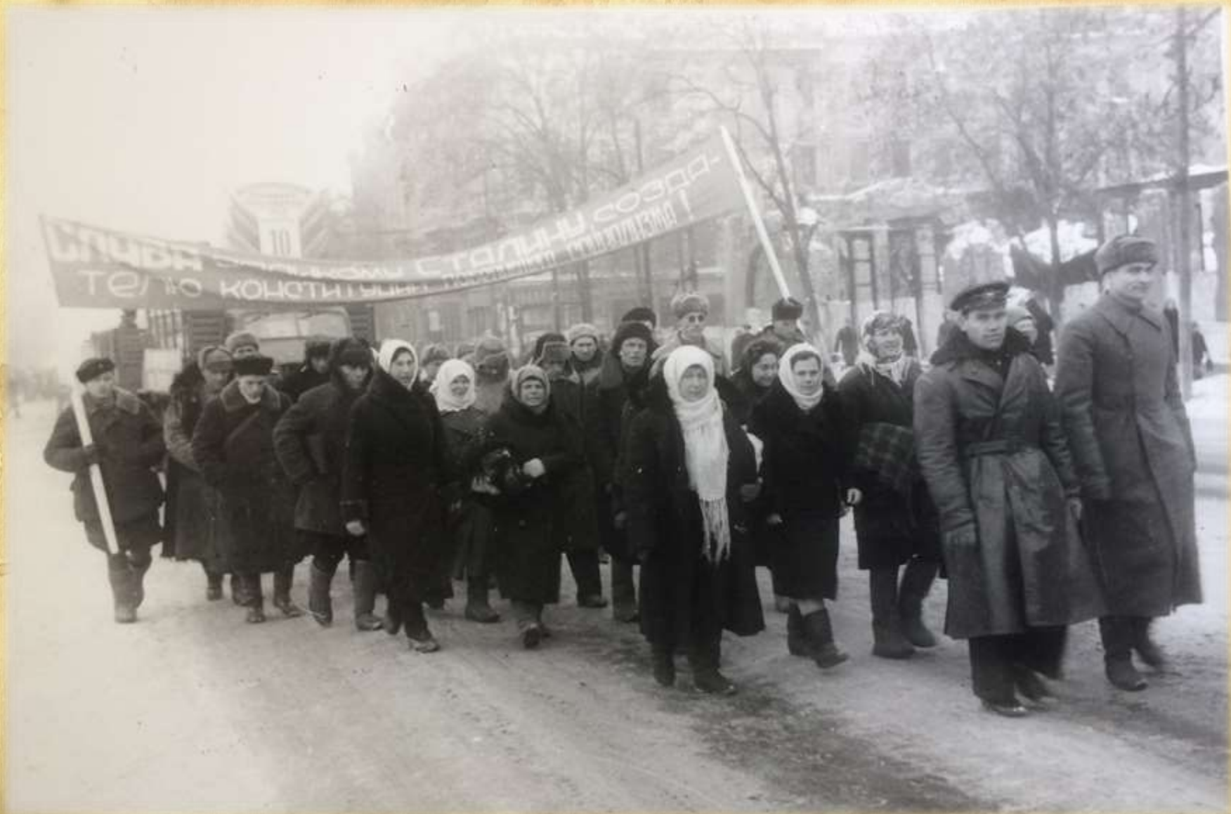
Трудящиеся г. Сальска на демонстрации. 1945 г.