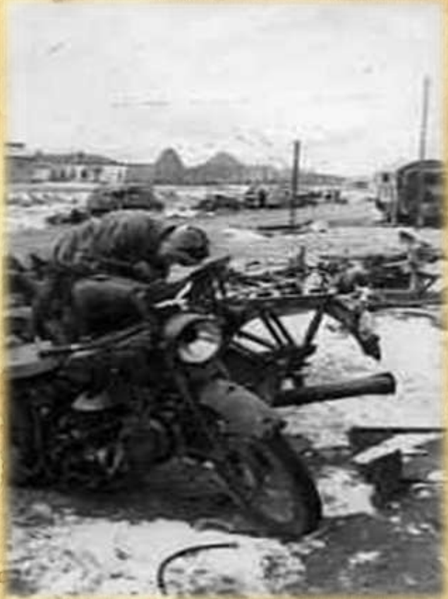
Сальск, автомашины и мотоциклы, брошенные немцами при отступлении. 1943 г.