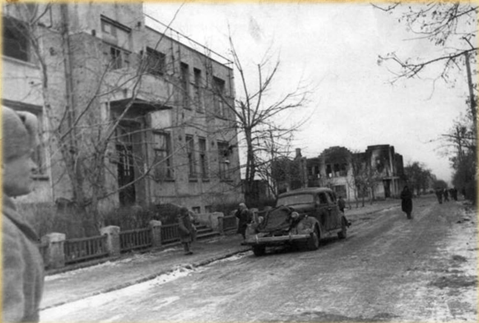
Улица Ленина в городе Сальске, освобожденном от немецкой оккупации. На переднем плане здание милиции, далее разрушенные универмаг и бывшее здание Заготзерно (ныне музей им. Нечитайло). Февраль 1943 г.