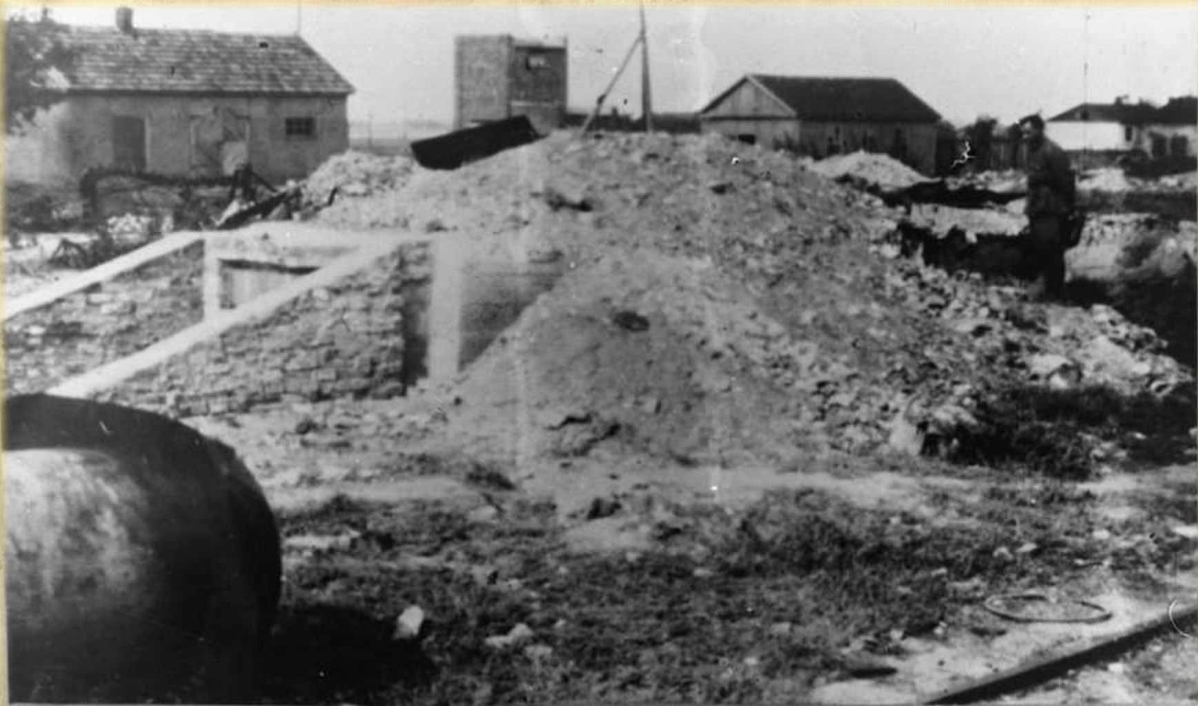
Место, где был комбикормовый завод, после взрыва его немецко-фашистскими самолетами в январе 1943 г./

Разрушенный комбикормовый завод. Январь 1943 г.