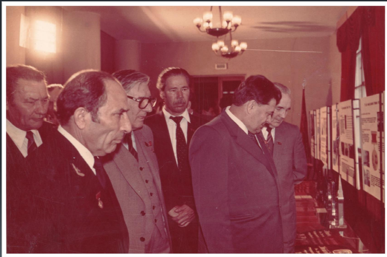
Фонд Р-1045, Опись 1, Дело 864.