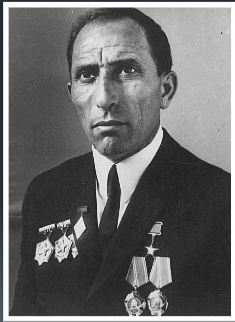
Фонд Р-1045, Опись 1, Дело 835.

После демобилизации, по приглашению однополчанина, приехал в город Армавир (Краснодарский край), работал на консервном заводе. Посетив в отпуске родной город жены Новошахтинск, познакомился с трудом шахтёров. Вскоре переехал к родне и устроился на шахту «Южная-1». Вскоре, после обрушения в шахте, вернулся в Армавир, но ненадолго.