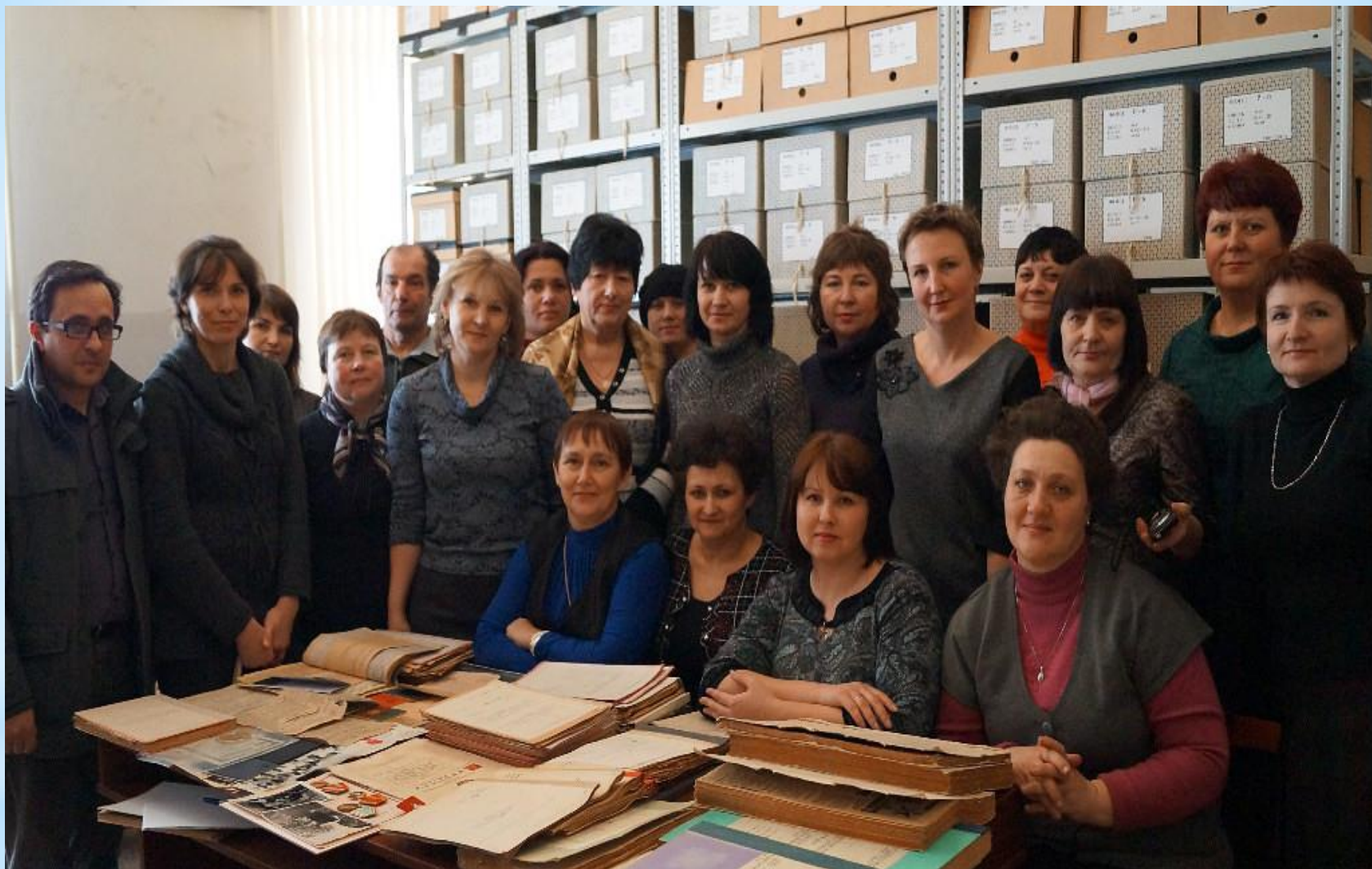
04.03.2014. Семинар учителей истории школ Семикаракорского района.