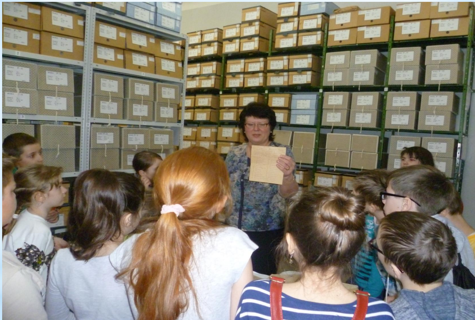
Школьный урок посвящен 100-летию юбилею архивов России.