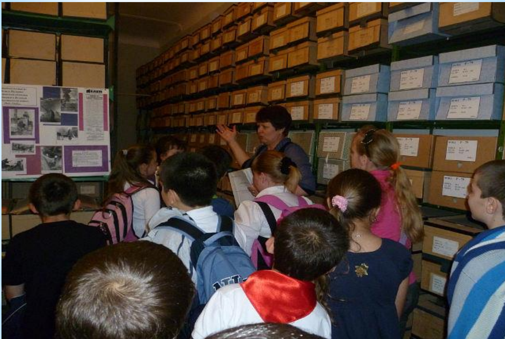
Обзорная экскурсия "Прикоснись к истории..."