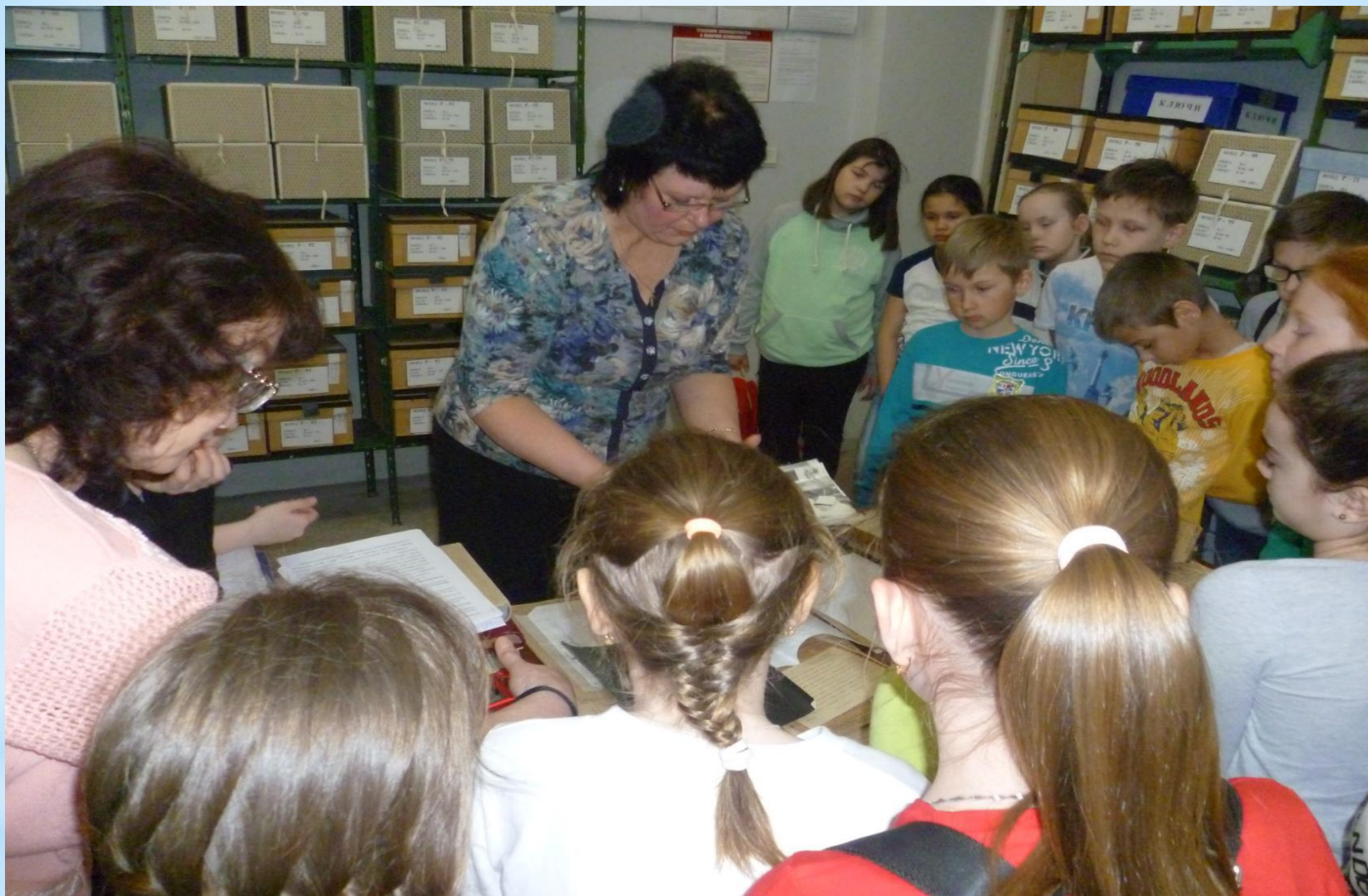
06.04.2018 гости архива - учащиеся 4 класса Семикаракорской общеобразовательной школы №1 им. Б.Н. Куликова