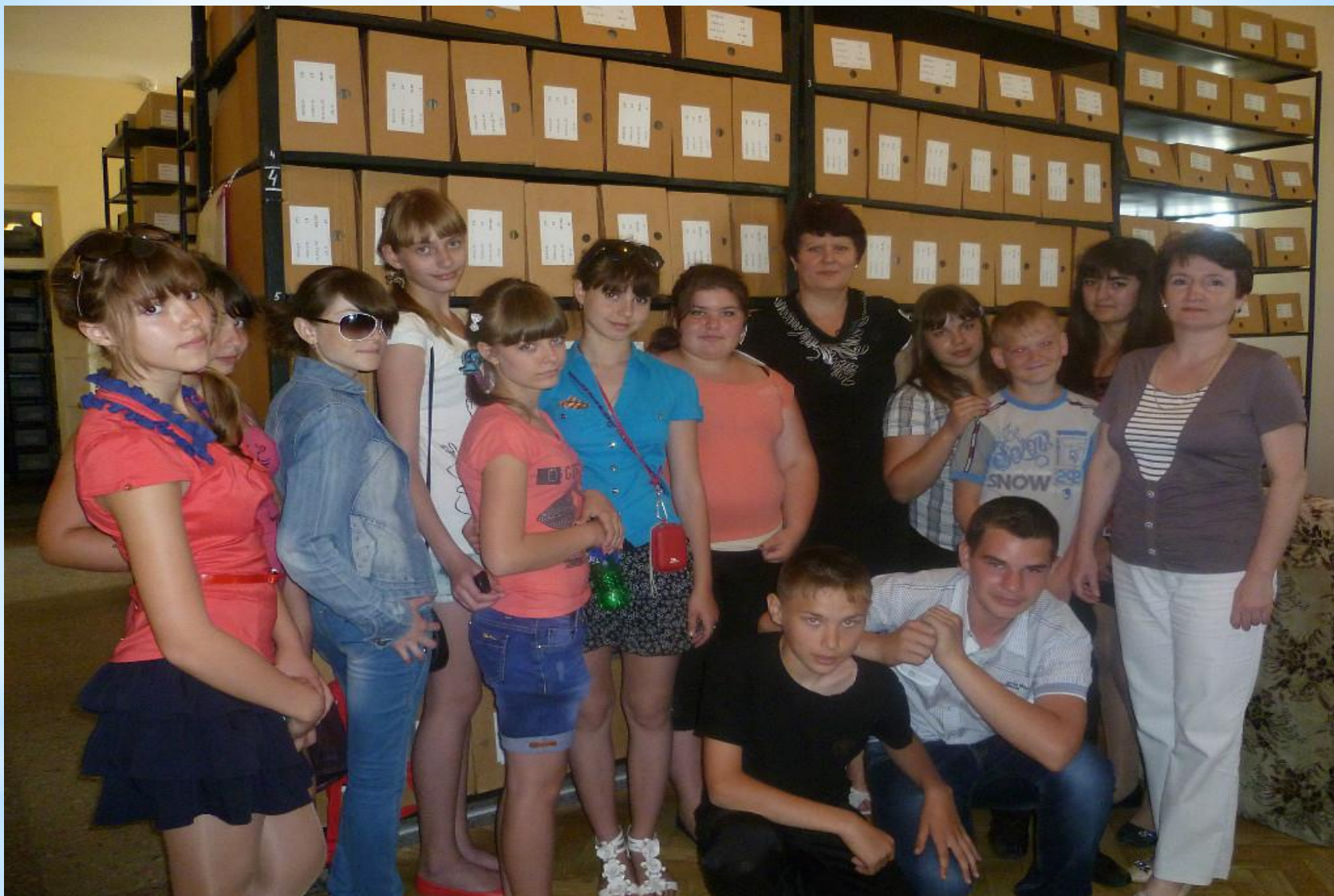
Ребята из Новозолотовской общеобразовательной школы гости архива.