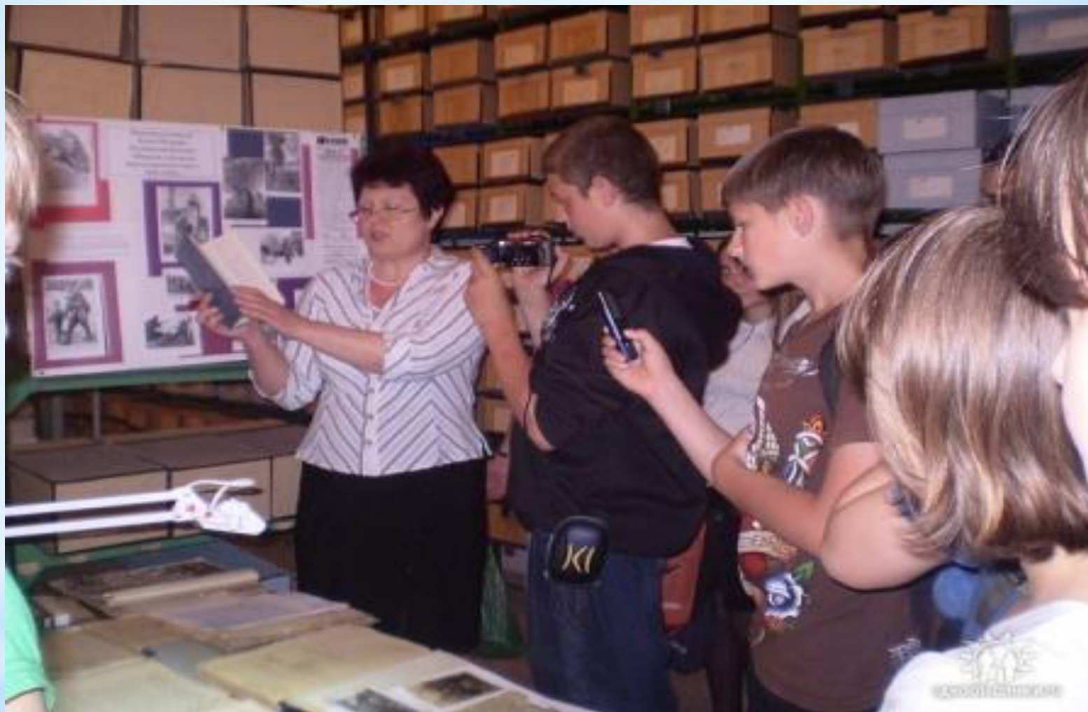
28 мая 2010 год. Учащиеся 7 класса Семикаракорской общеобразовательной школы № 1. Уроки истории побуждают подростков мыслить, чувствовать сопричастность отдельного человека к судьбе всей страны.