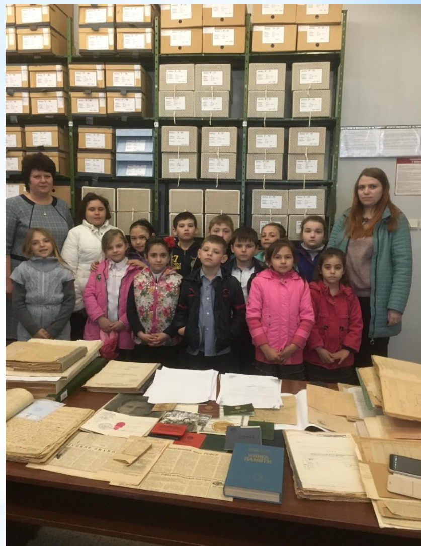
19.04.2019 год. Школьный урок посвящен 95-летию Семикаракорского района. Учащиеся Сусатской общеобразовательной школы.