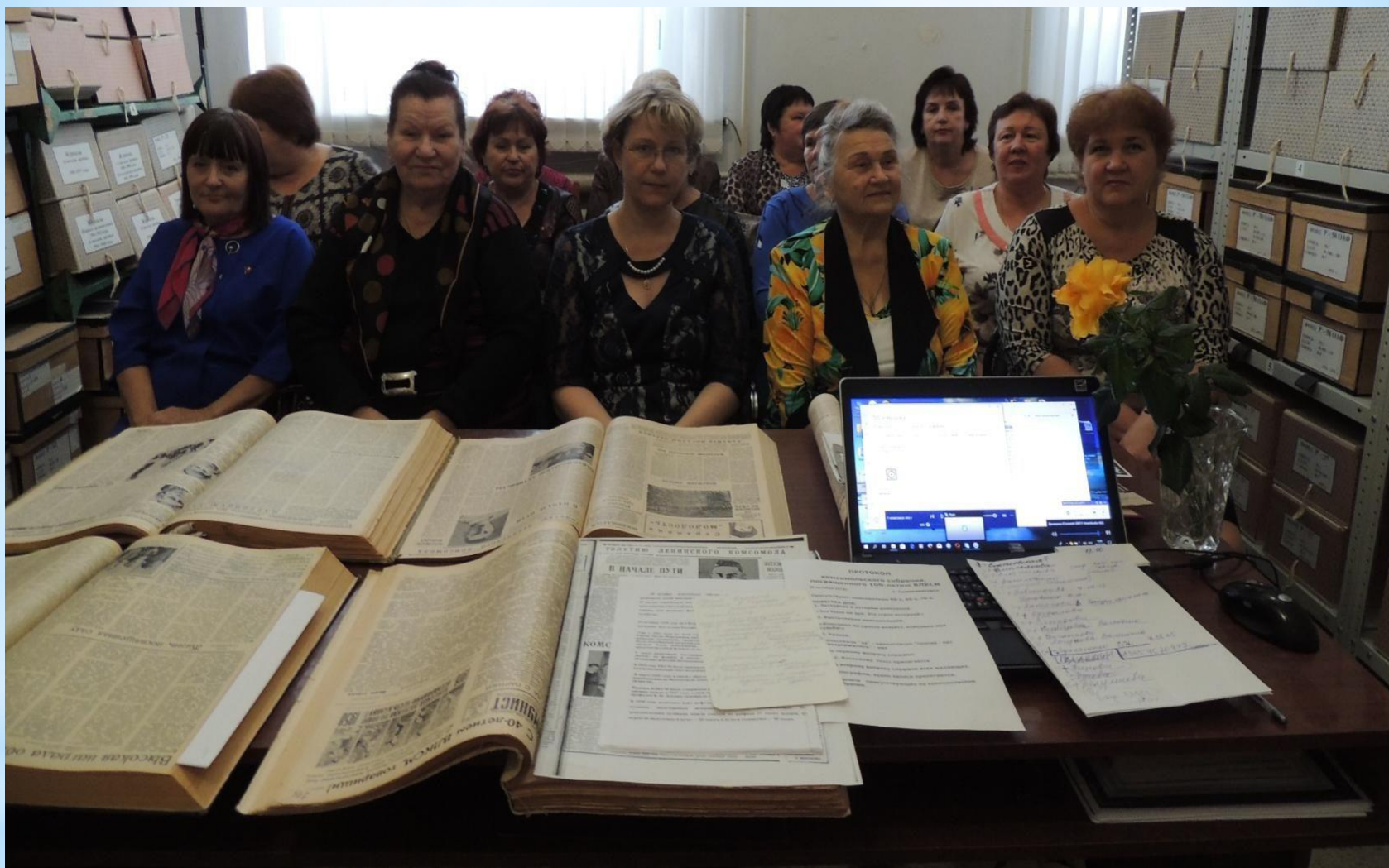
"Комсомольское собрание - 100 лет ВЛКСМ» Присутствовали комсомольцы 50-х, 60-х, 70-х, 80-х.