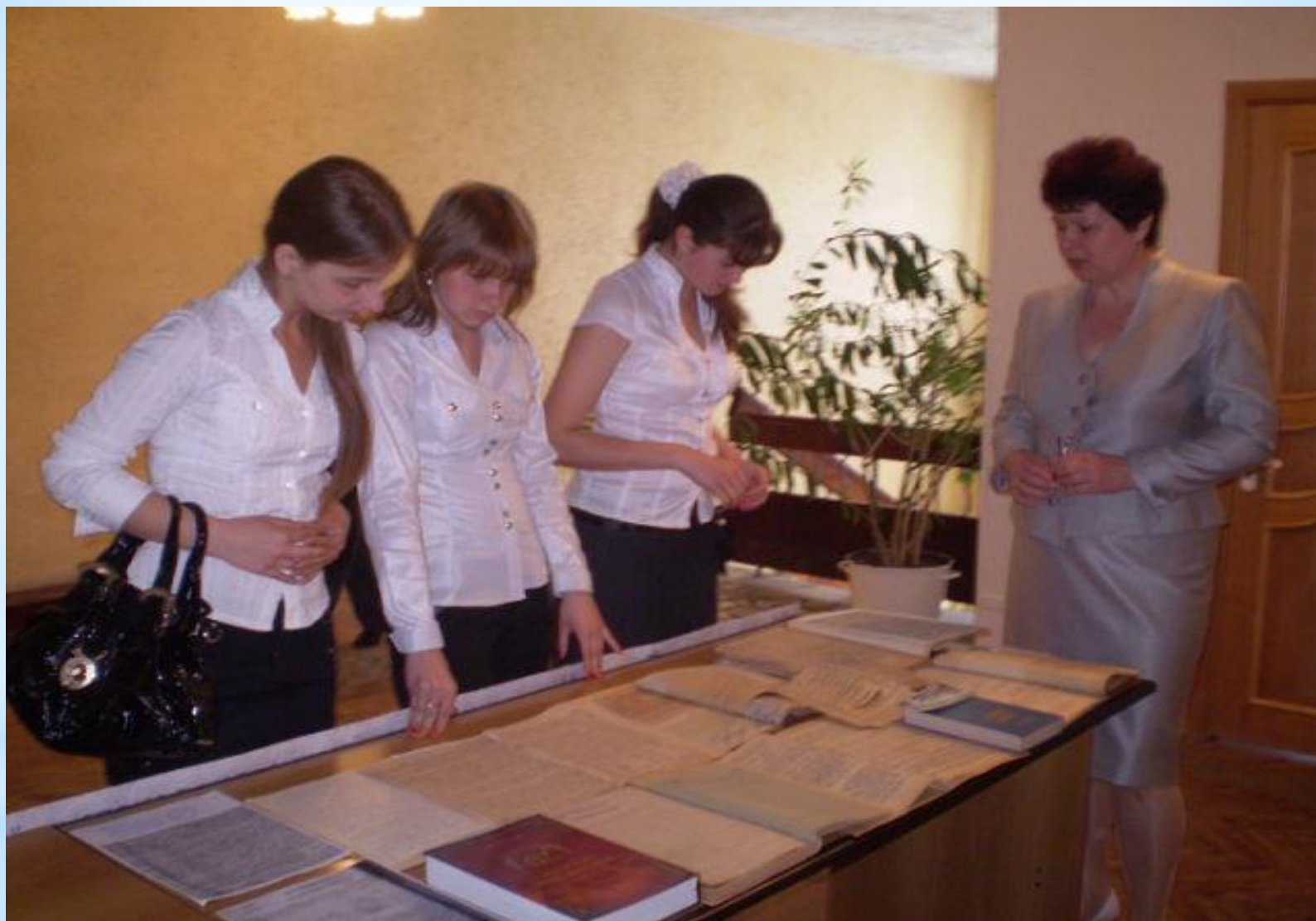
Выставка документов военных лет (1941-1945 гг.) Районный Дом культуры.