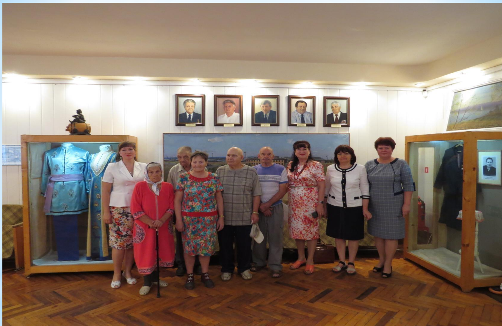
Краеведческий музей Семикаракорского района. Экскурсия и выставка архивных документов для пенсионеров из дома-интерната.