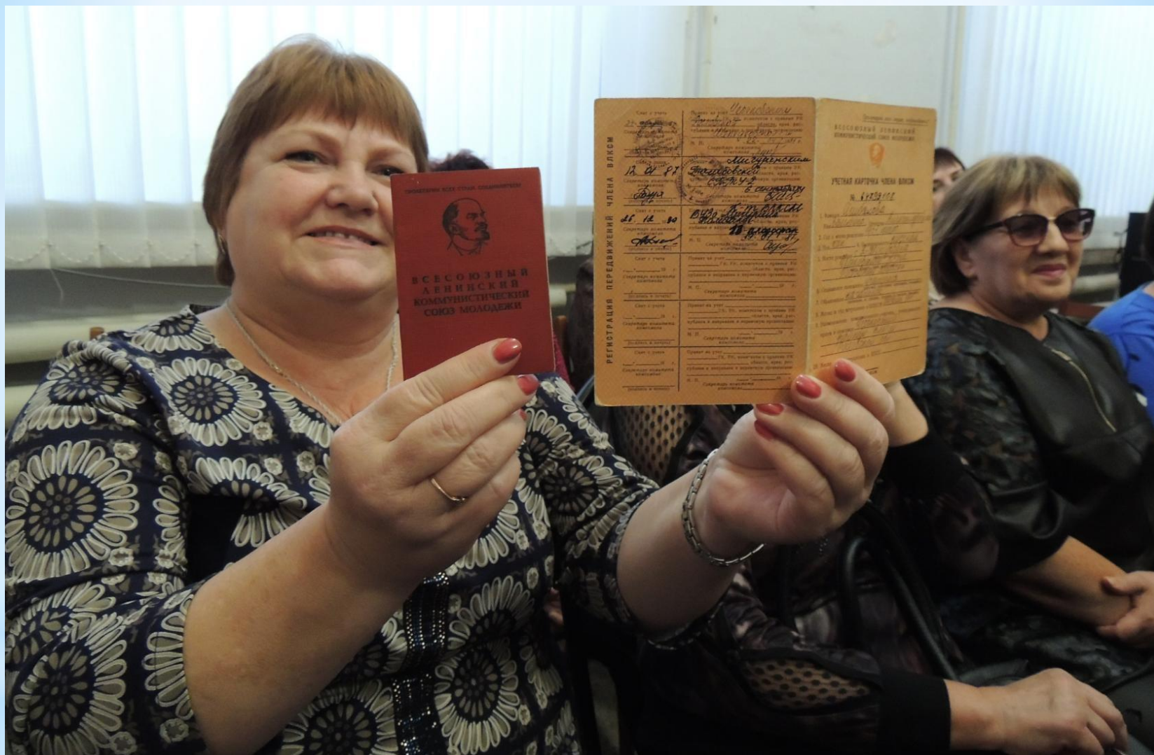
Комсомольцы разных лет пришли на собрание с комсомольскими билетами и значками.