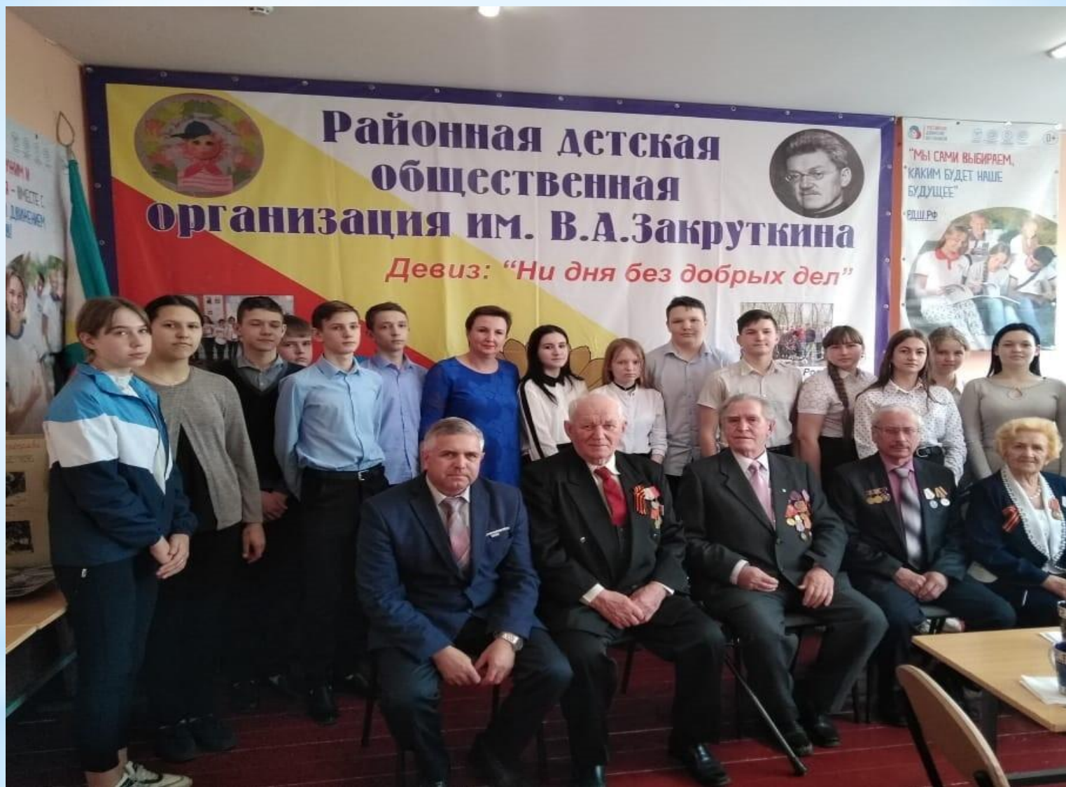
20.02.2020. Дом детского творчества Семикаракорского района. Встреча посвящена Дню защитника Отечества.