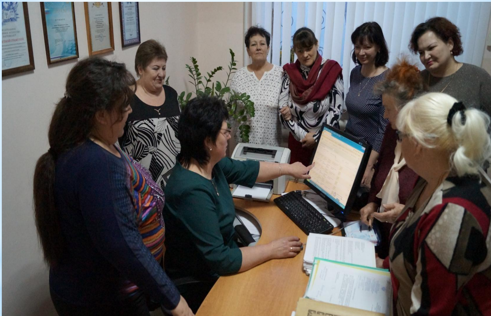
2018 год. Гости архива - архивисты, работавшие в разные годы в муниципальном архиве.