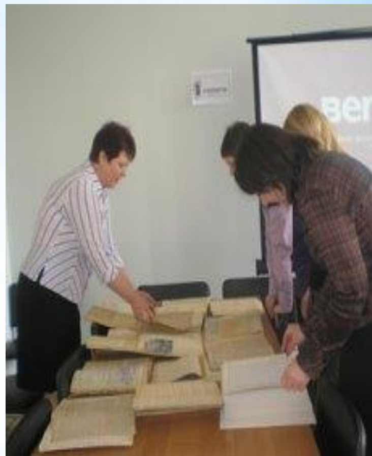
Выставка архивных документов для работников Администрации Семикаракорского района