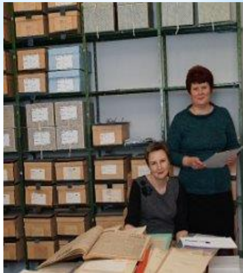
Семинар для учителей истории «Донская история в архивных документах»