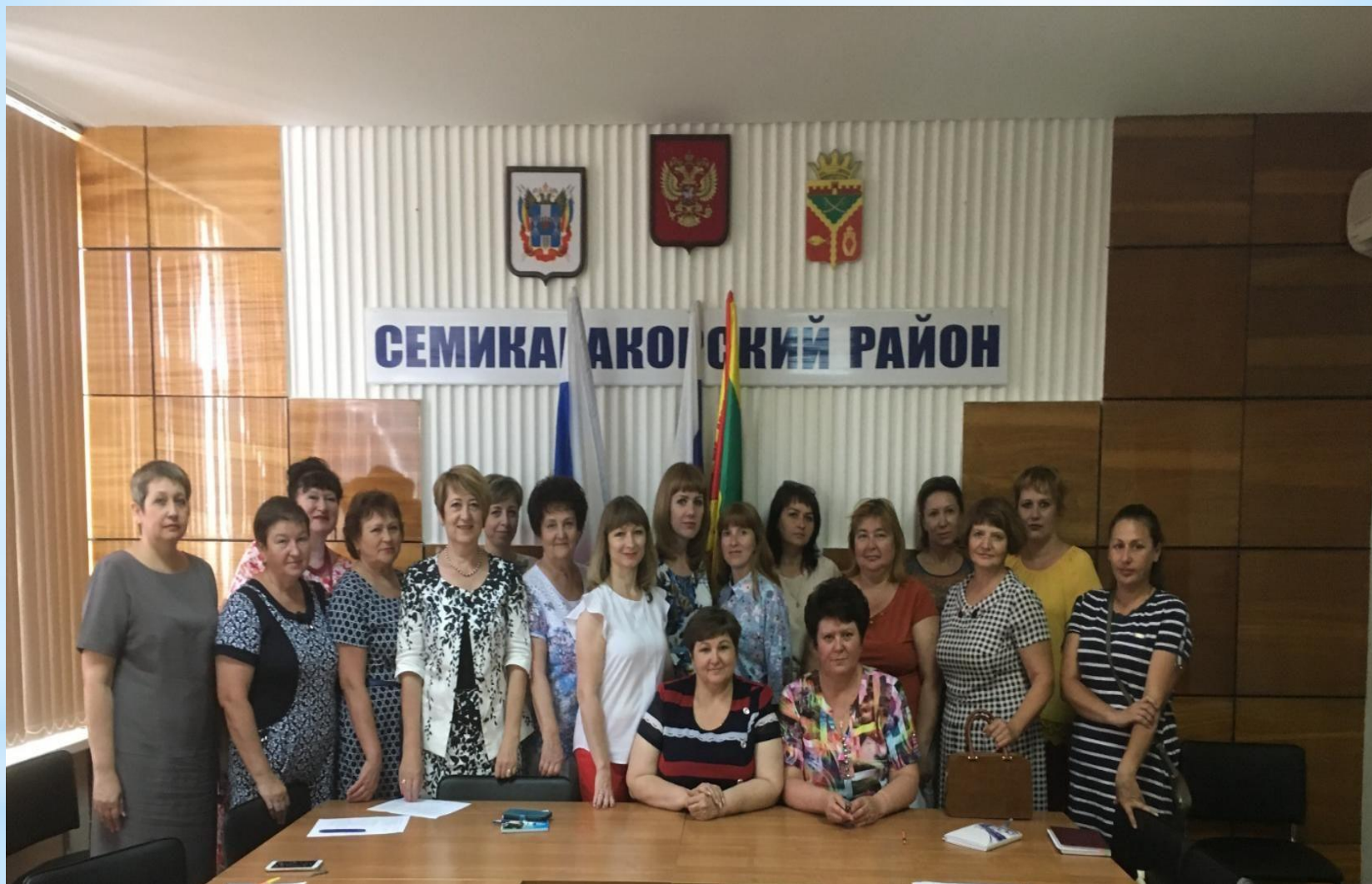
Архивисты Семикаракорского района.