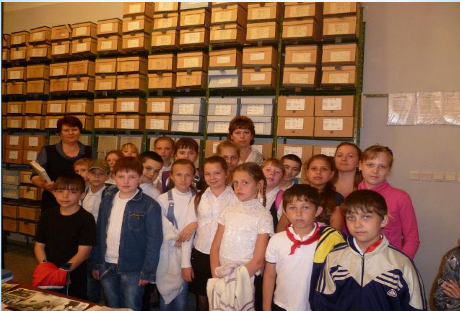
Учащиеся Семикаракорской общеобразовательной школы № 2 им. А.А. Араканцева провели классный час в архиве.