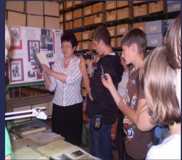
Фотографии выставок, школьных уроков, семинаров из фотоархива сектора «Муниципальный архив» Администрации Семикаракорского района Ростовской области