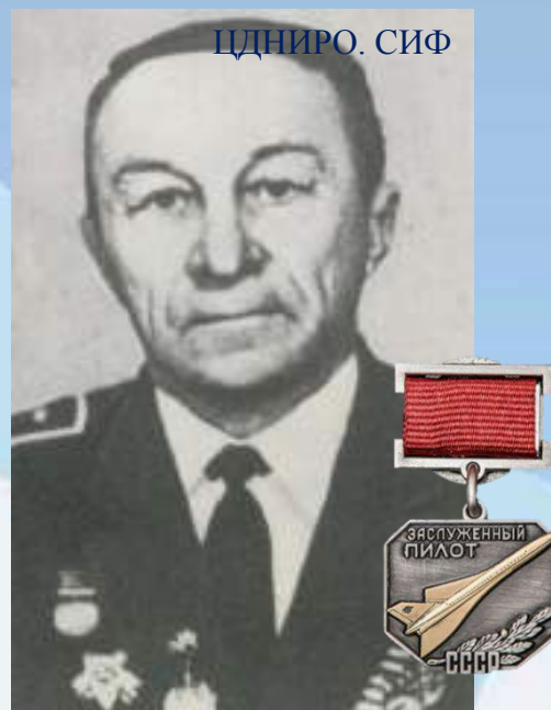
Николай Степанович Романов, Заслуженный пилот СССР