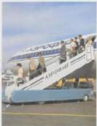
Аэрофлот к юбилею Победы Авиаторы 45 лет в небе России