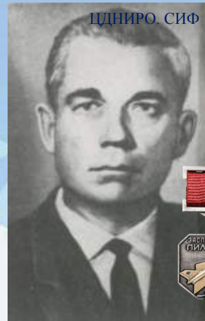
Виталий Иванович Останин, Заслуженный пилот СССР