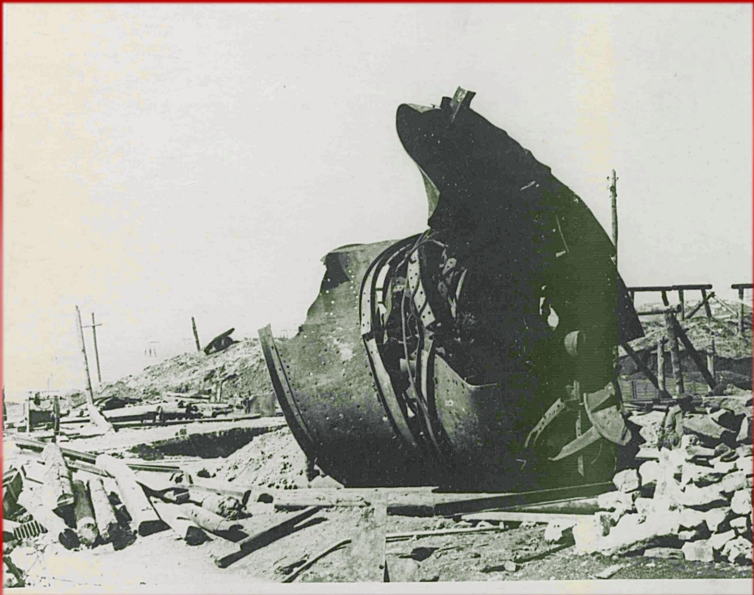
Разрушенная шахта «Комсомольская правда» треста «Шахтантрацит» комбината «Ростовуголь». г. Шахты. 1943 г. (Фонд Р-1045, Опись 8, Дело 303)