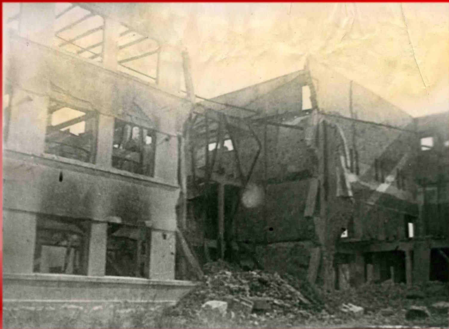
Разрушенный горный техникум. г. Шахты. 1943 г.