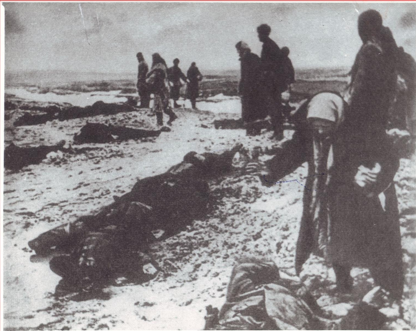
Люди ищут своих родственников среди расстрелянных немецко-фашистскими оккупантами. Ростов-на-Дону. 1941 г. (Фонд Р-1105, Описание 3, Дело 18)