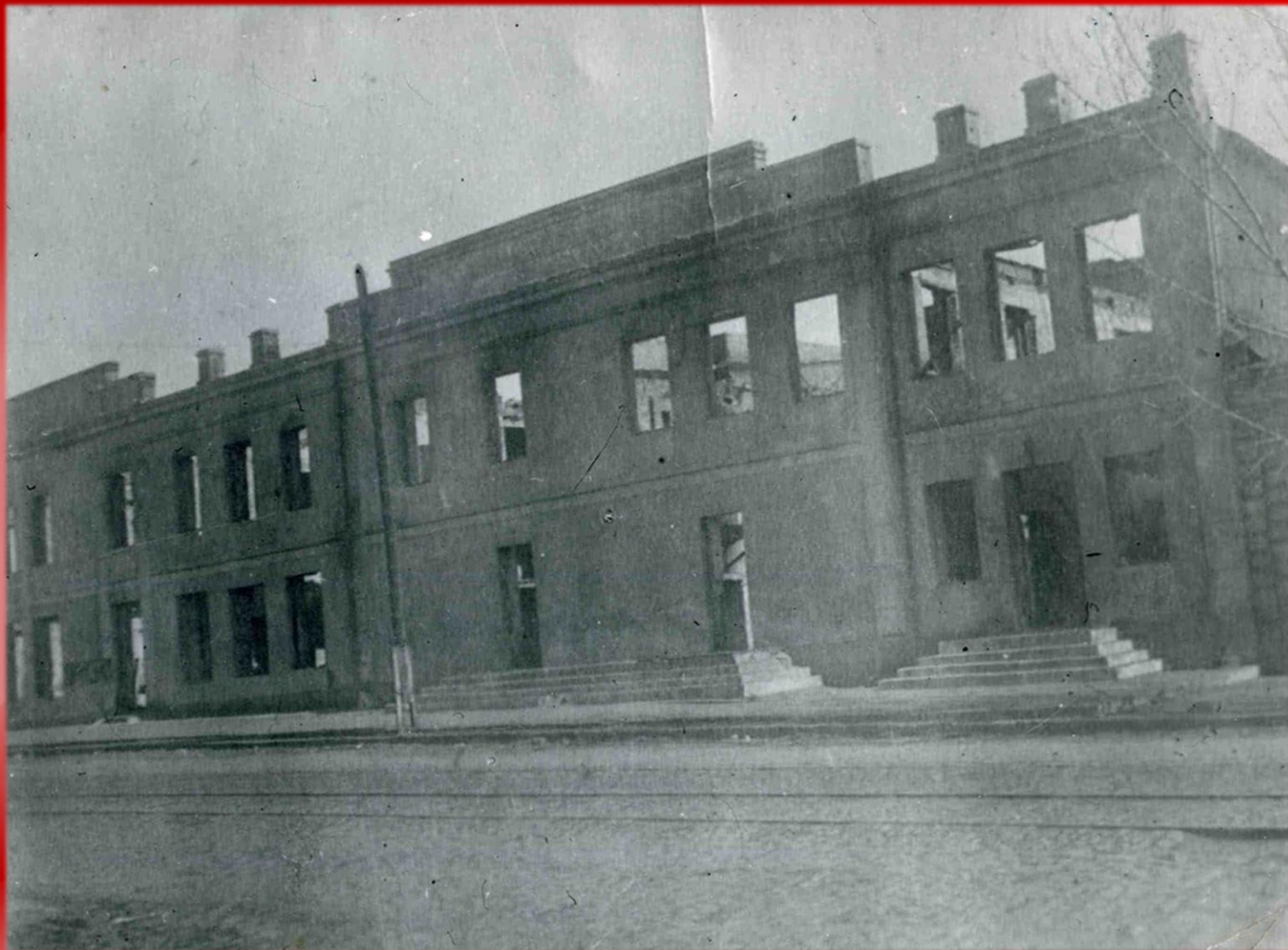
Сожженный Дом печати. г. Шахты. 1943 г.