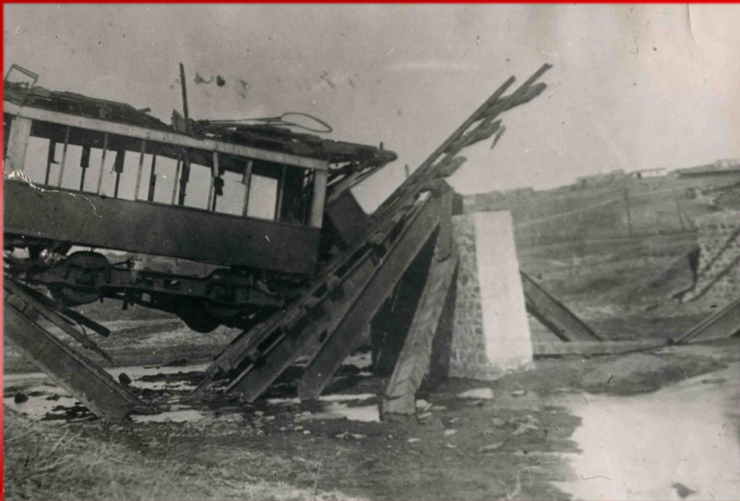
Взорванные трамвайные пути в районе Грушевского моста со стороны ул. Советской г. Шахты. 1943 г. (Фонд Шахтинского краеведческого музея)