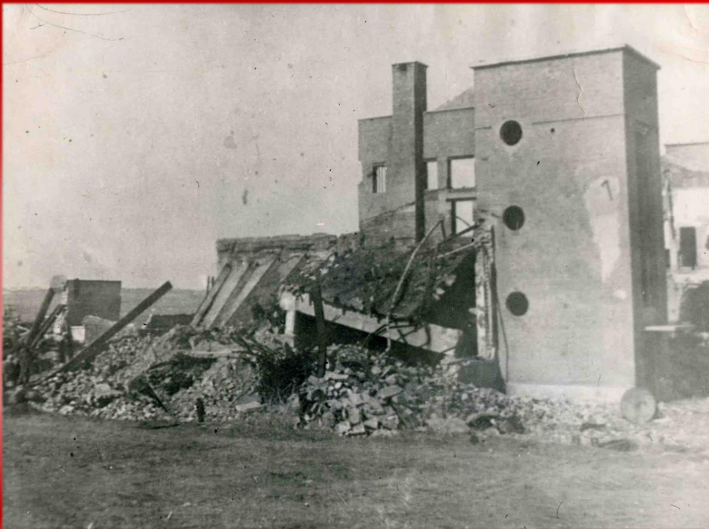
Разрушенный хлебозавод. г. Шахты. 1943 г.