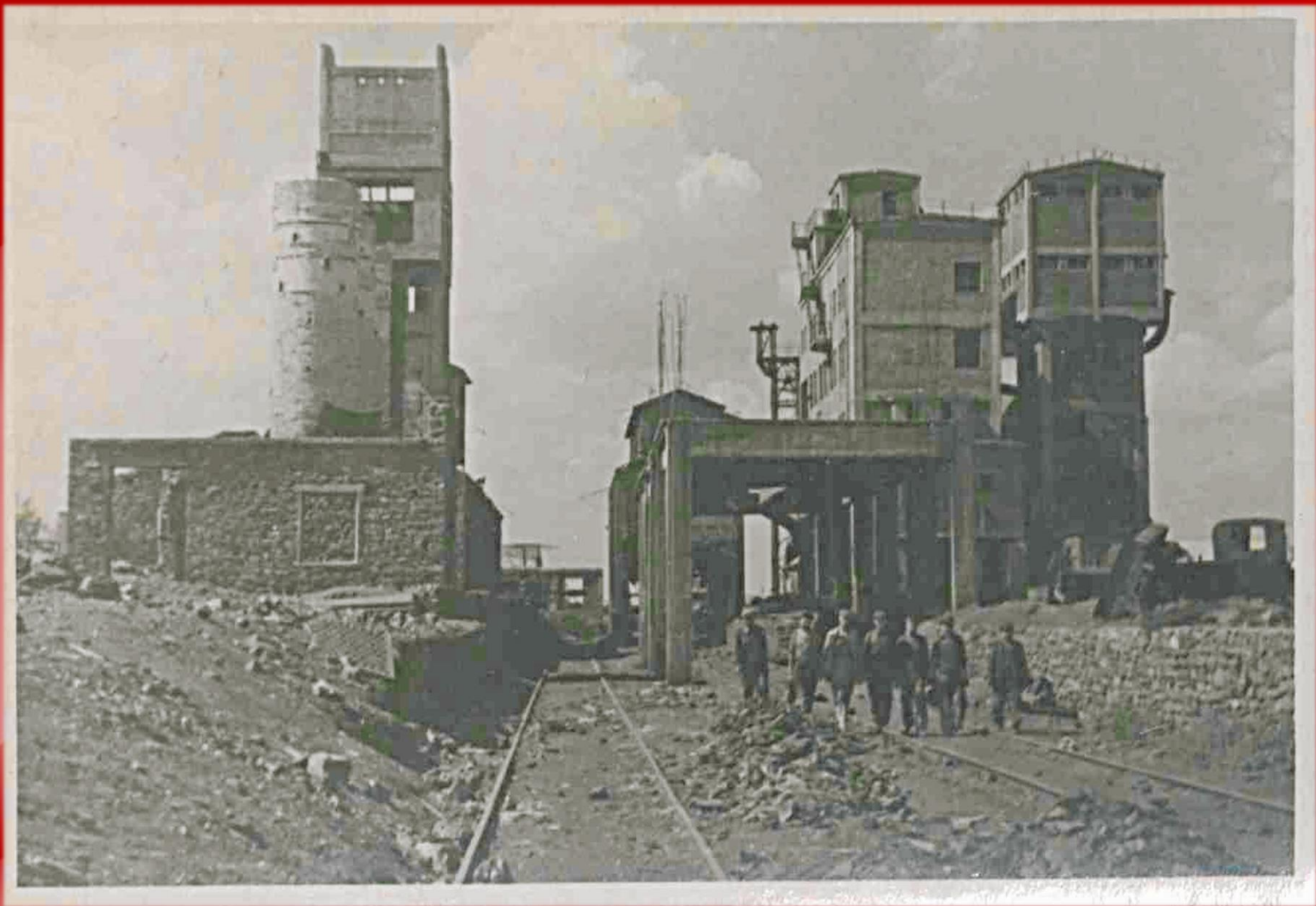
Разрушенная шахта «10 лет за Индустриализацию» (далее: «Нежданная») треста «Шахтантрацит» комбината «Ростовуголь». г. Шахты. 1943 г. (Фонд Р-1045, Опись 8, Дело 227)