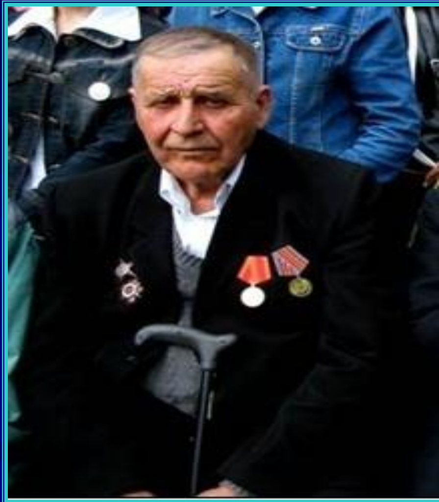
И.И.Белоусов в годы боевой молодости.