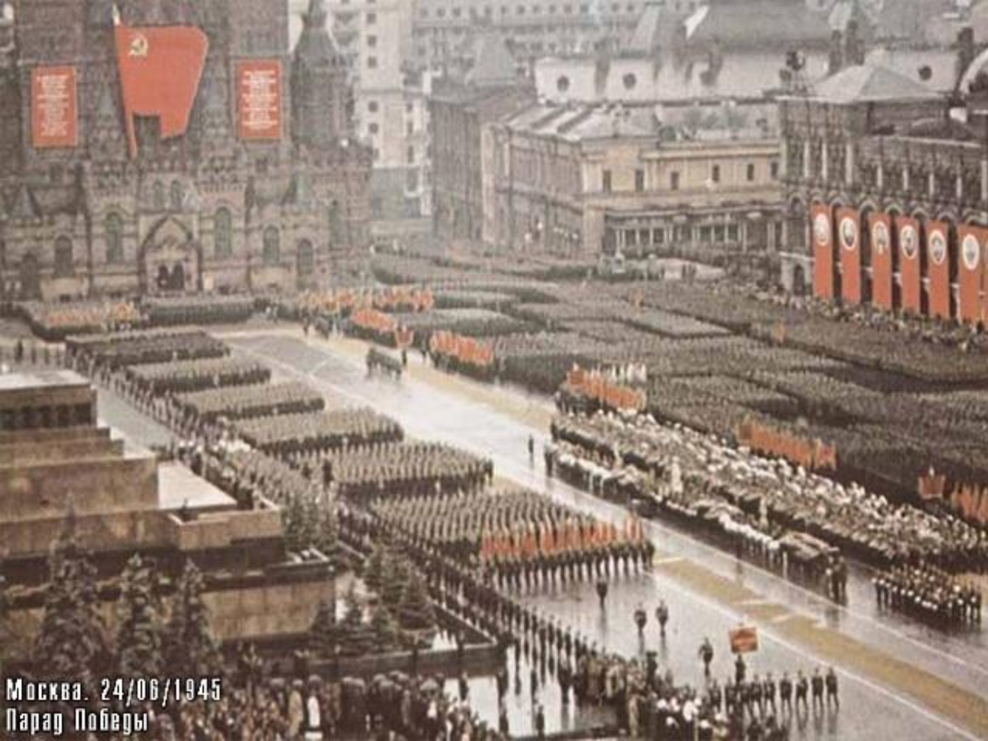
Москва. 24/06/1945 Парад Победы