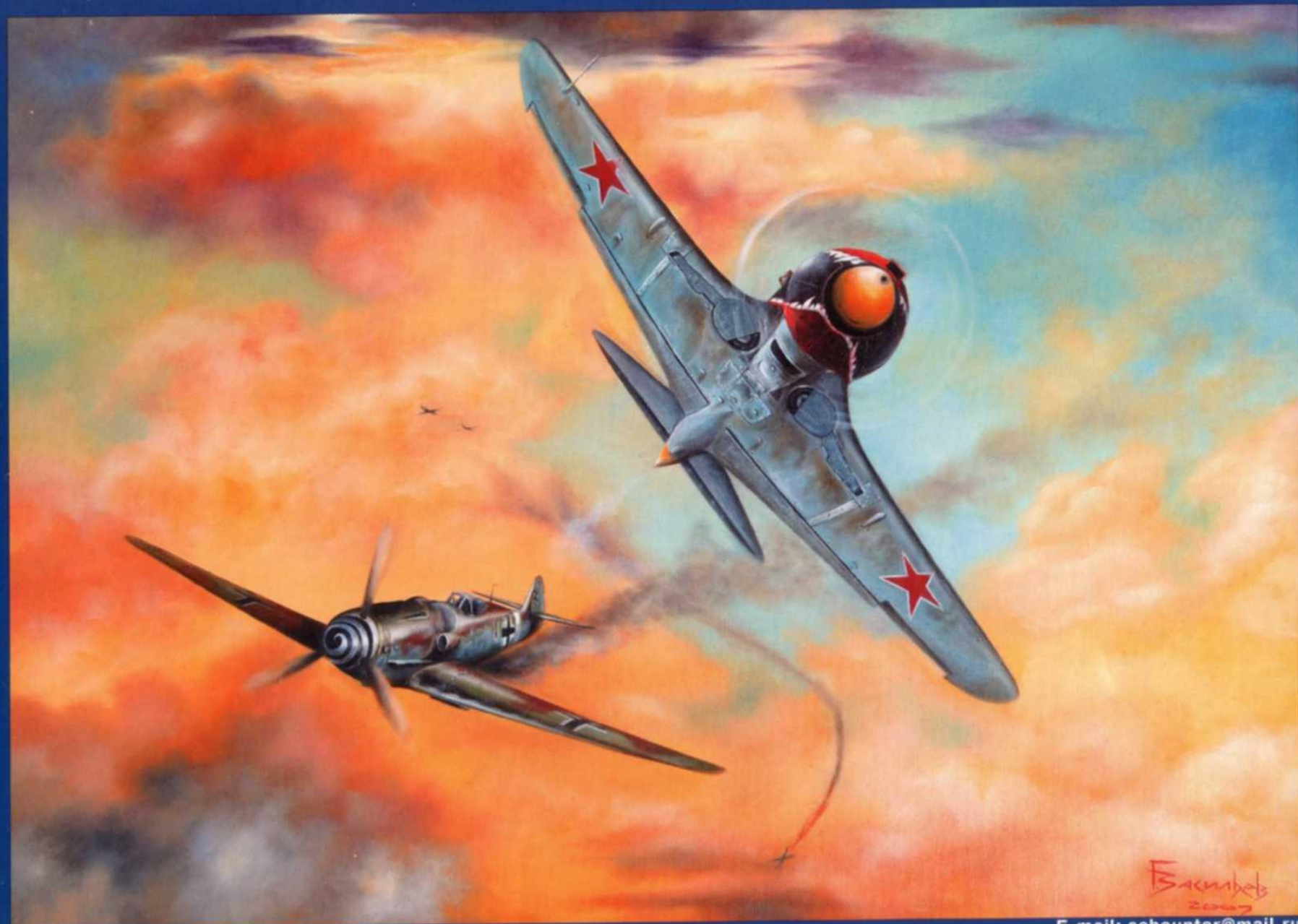
Рисунок Глеба Васильева