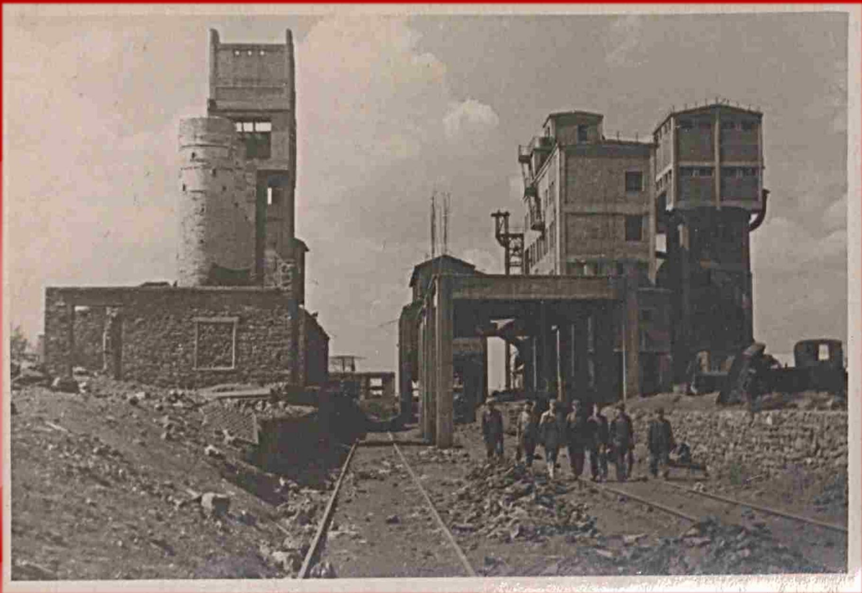
Разрушенная шахта «10 лет за Индустриализацию» (далее: «Нежданная») треста «Шахтантрацит» комбината «Ростовуголь». г. Шахты. 1943 г. (Фонд Р-1045, Опись 8, Дело 227)